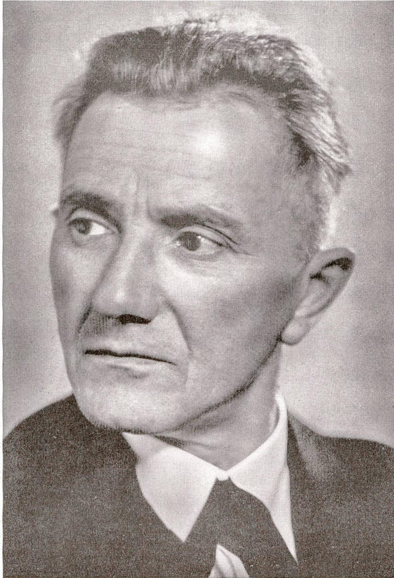
Spreng SWB Basel