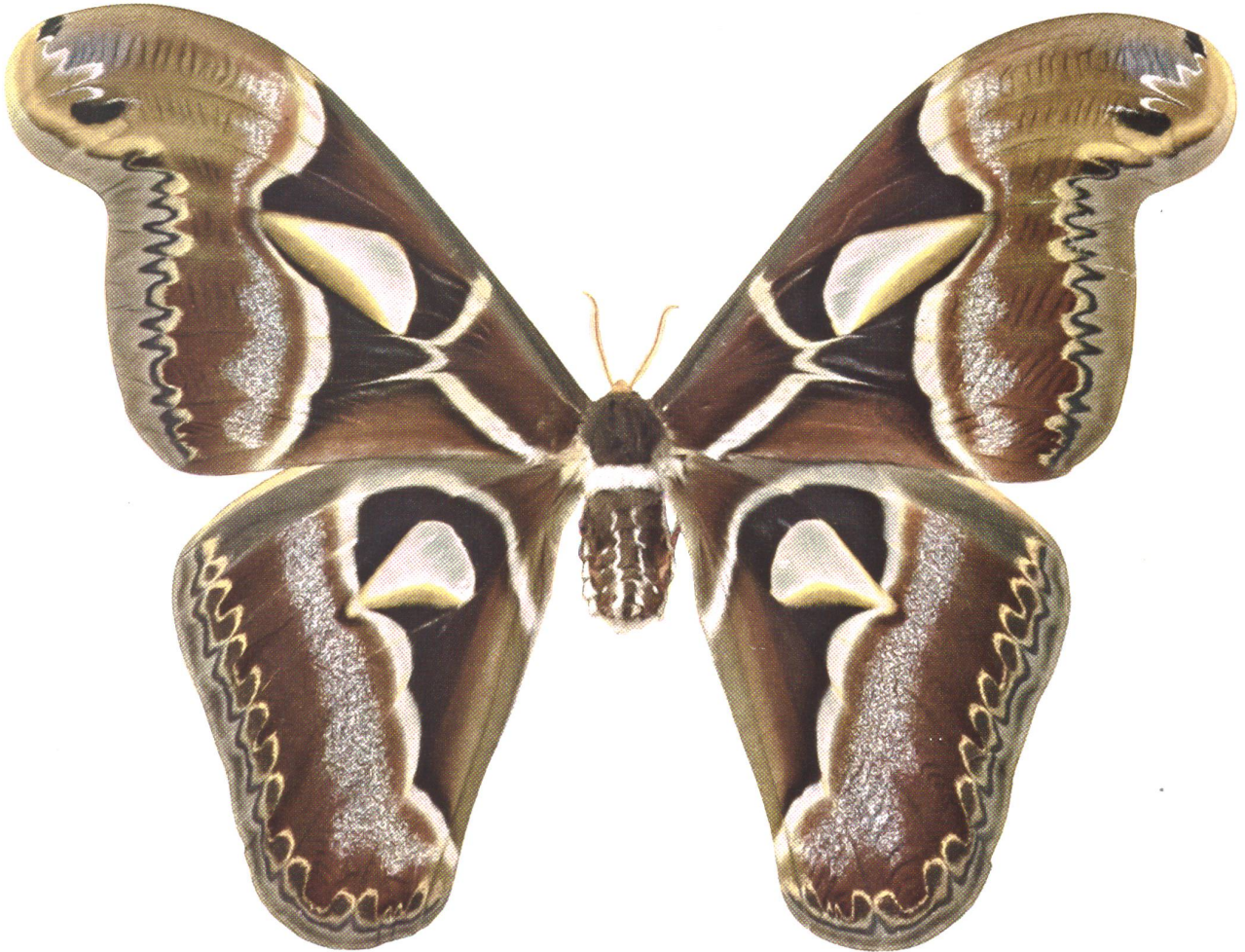
Attacus Edwardsi · White Sammlung A. Hoffmann

Aus der Puppe gezüchtet, gehört zu den größten Schmetterlingen der Erde, in seinem Gesamtkolorit zu den schönsten seiner Artengruppe. Er bewohnt die südlichen Täler des Himalaja und Assam