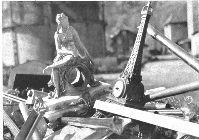
Die «Prunkstücke» für die Sammlung «Metallspende schafft Arbeit und Brot»

Und diese Menschen waren dankbar für die Hilfe, die ihnen gewährt werden konnte, wie das folgende Gedicht beweisen mag, welches die Lagerinsassen des Bades Lostorf am 28. Oktober 1943 an die Ad- resse des zivilen Frauenhilfsdienstes rich- teten: