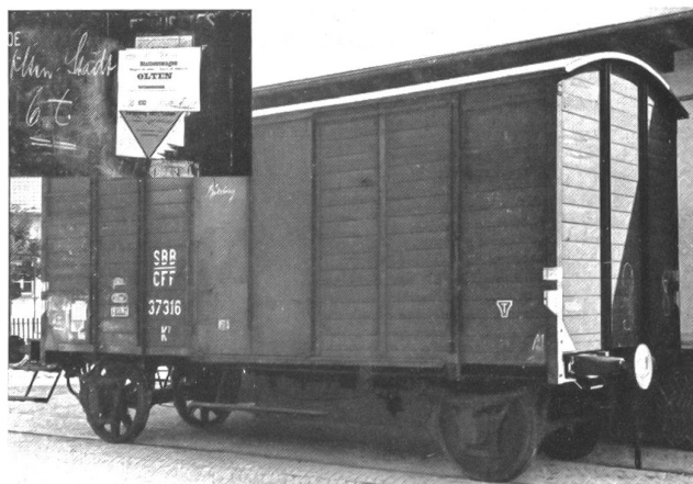
Hülsefrüchtesammlung 1946 für das hungernde Ausland Der Rekordwagen der Stadt Olten mit 6360 kg Hülsefrüchten