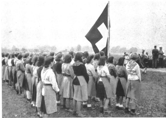
September 1943. Der Hilfstrupp Olten legt das Versprechen ab

Die Kriegszeiten mit ihren Folgen zeigten die Notwendigkeit, daß der militärische wie der zivile Frauenhilfsdienst sich mit der inneren Haltung und Gesinnung und der geistigen Einstellung des Schweizervolkes zu befassen habe. Es hieß immer wieder, die Schweizerfrauen an tapferes Durchhalten zu erinnern und treue Arbeit an sichtbaren und unsichtbaren Posten zu leisten. Besonders nötig war der Aufklärungsdienst, nachdem erst heimlich geflüstert wurde, man hätte von einer Umgruppierung unserer Armee gehört. Etwas