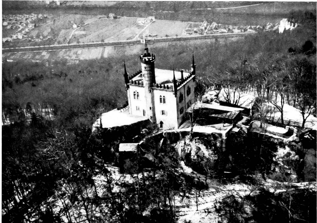
Heutiges Schloß Wartburg-Säli