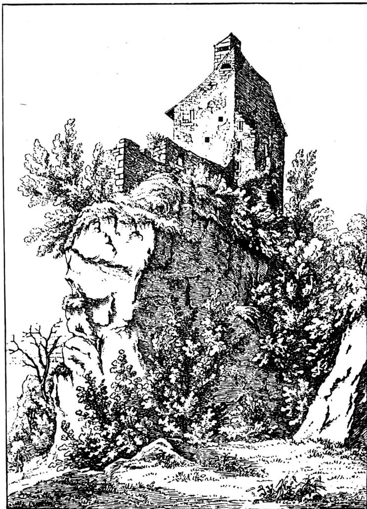
Neuwartburg zur Sälischloß, 13 Septbr. 1839

Seit 1547 blieb das Amt des Feuerwächters erblich in der wohl vorher in Dulliken seßhaften Familie Sächeli. Bei Nachforschungen über