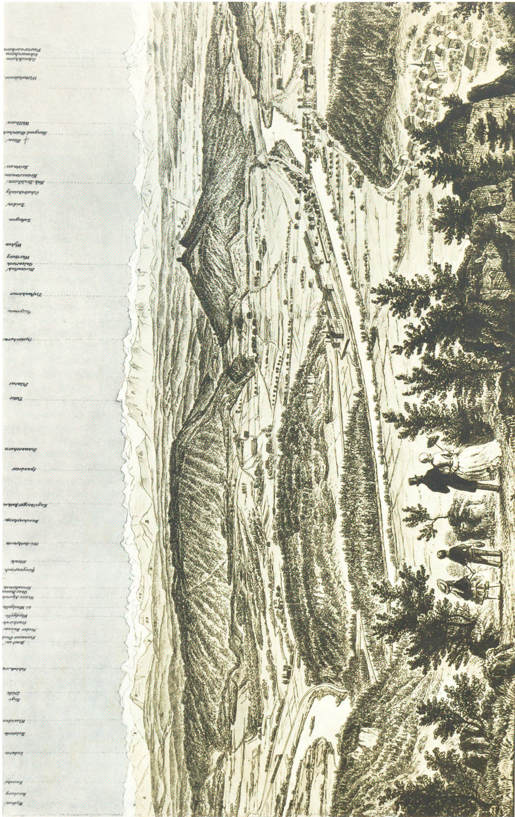
Panorama von Frohburg vom Schloßberg aufgenommen dessiné d'après nature par R. Huber