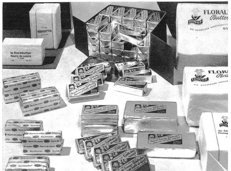
Diverse Buttersorten unserer Fabrikationsstelle für Markenbutter in Basel

Ein solcher städtischer Milchversorgungsbetrieb erfüllt große Aufgaben im Dienste der Volksgesundheit. Die Verbandsmolkerei Olten ist ein Betrieb, ohne den man sich das Wirtschaftsleben unserer Gegend nicht mehr denken kann. Wir werden die an uns gestellten Aufgaben im Dienste der Konsumenten auch weiterhin freudig und zuverlässig erfüllen und damit dem Wohl der Gesamtheit dienen.