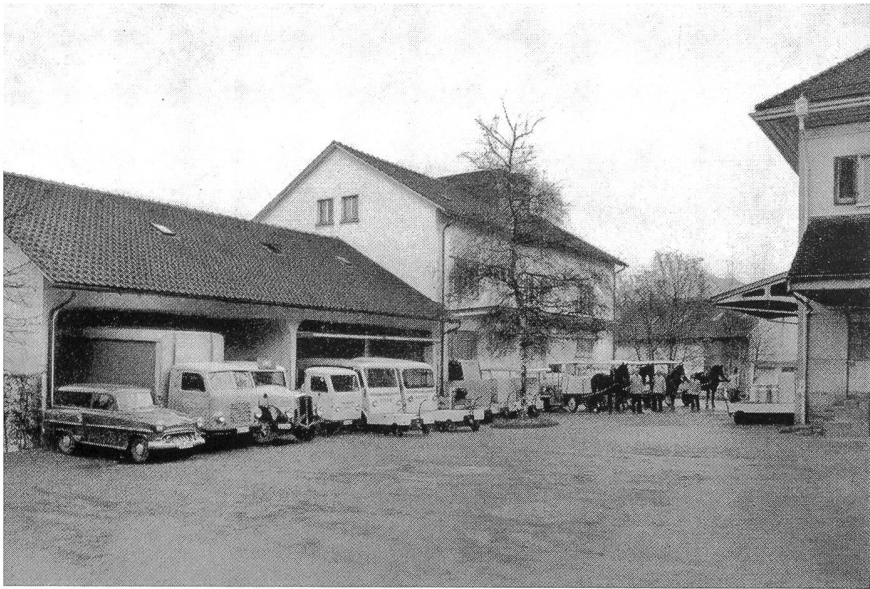
Verbandsmolkerei Olten — Fuhrpark

stellen eingelieferte Milch mußte in vermehrtem Maße zentrifugiert werden. Die Verbandsmolkerei erhielt bereits schon im Jahre 1932 von 100—120 Zentrifugierstellen und Käsereien 10—12 000 Tagesliter Rahm zur Verarbeitung auf pasteurisierte Vorzugsbutter «Floralp», nachdem der Betrieb auf 1. Mai 1931 als Markenbutterfabrikationsstelle offiziell anerkannt wurde. Die Jahresproduktion an Butter überstieg in den nachfolgenden Jahren 100 Wagen à 10 000 kg.