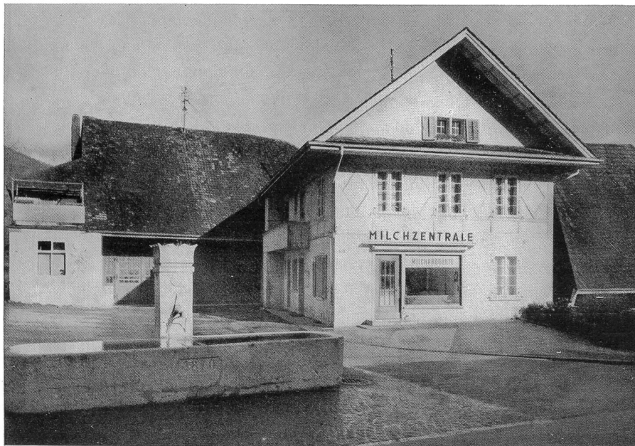
Verbandsmolkerei Olten Filiale Trimbach

Die Consummolkerei hat, als es notwendig war, eine wichtige Mission erfüllt; sie war kein Verlustbetrieb, aber für die Mitglieder auch keine Notwendigkeit mehr, und man konnte sich andern genossenschaftlichen Problemen zuwenden...»