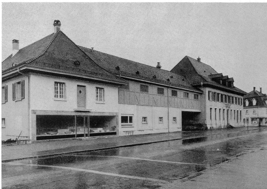
Verbandsmolkerei Olten Verkaufsladen

Eines der kostbarsten Nahrungsmittel, das uns die Natur bietet, ist die Milch. Sie enthält alle für die Ernährung notwendigen und unentbehrlichen Bestandteile in leicht verdaulicher Form und in einem normalen Verhältnis.