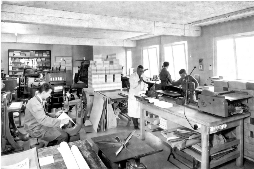
Buchbinderei Conrad Meyer Die heutige Werkstatt an der Belchenstraße