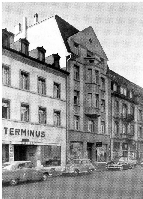
Frobürgstraße: Hotel «Terminus», Haus Trösch (Musikhaus Dettwyler–Konditorei Häner) Papeterie Meyer (Geschäftssitz 1898–1960)