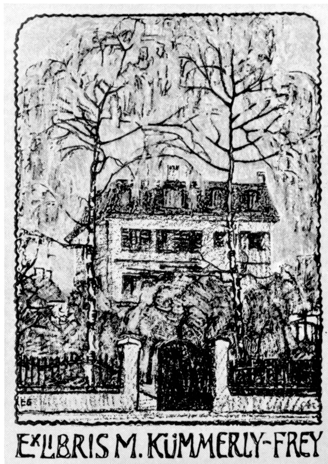
Das erste Gebäude der Kümmerly & Frey AG an der Hallauerstrasse in Bern