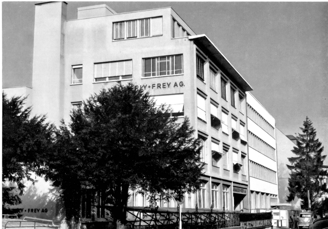
Neuer Trakt der Firma Kümmerly & Frey AG, Bern

Mit Unternehmungslust und Optimismus konnten die jungen Geschäftsleiter das Unternehmen durch die schweren Krisenjahre hindurchsteuern. In dieser Zeit wurde der grosse Maschinenaal gebaut. Eine für einen Kartenverlag schwere Zeit war der Zweite Weltkrieg. Der Karten-