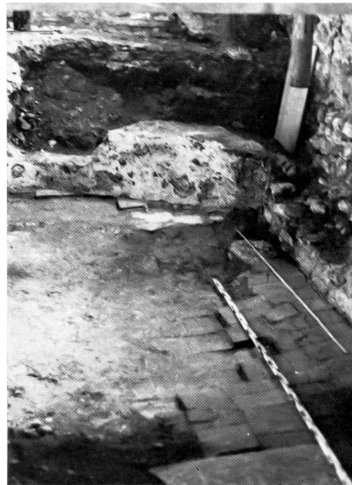
Abb. 8, Chorboden, Apsis und (rechts) Südmauer der alten Kirche.