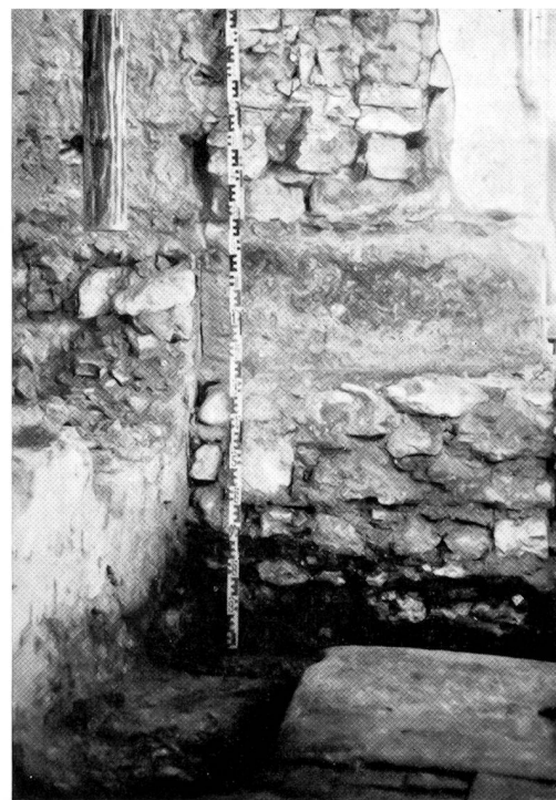
Abb. 5, dasselbe von der Chorseite. Im Vordergrund Taufsteinbasis.