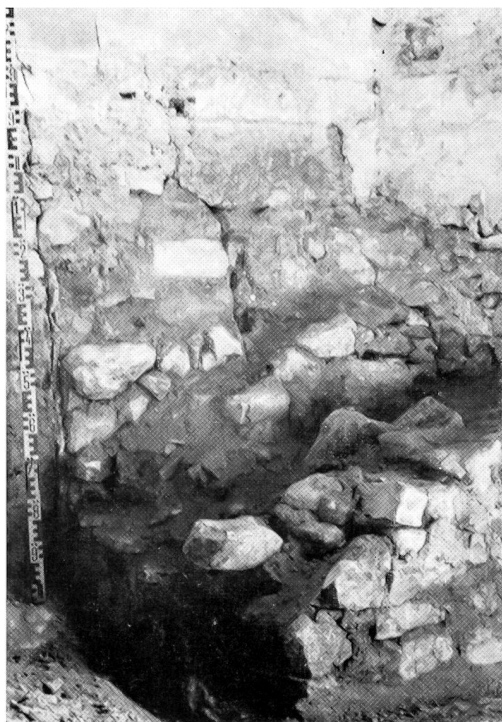
Abb. 4, Fundament der früheren Kirche (links) und des Wendelinsaltars (rechts).