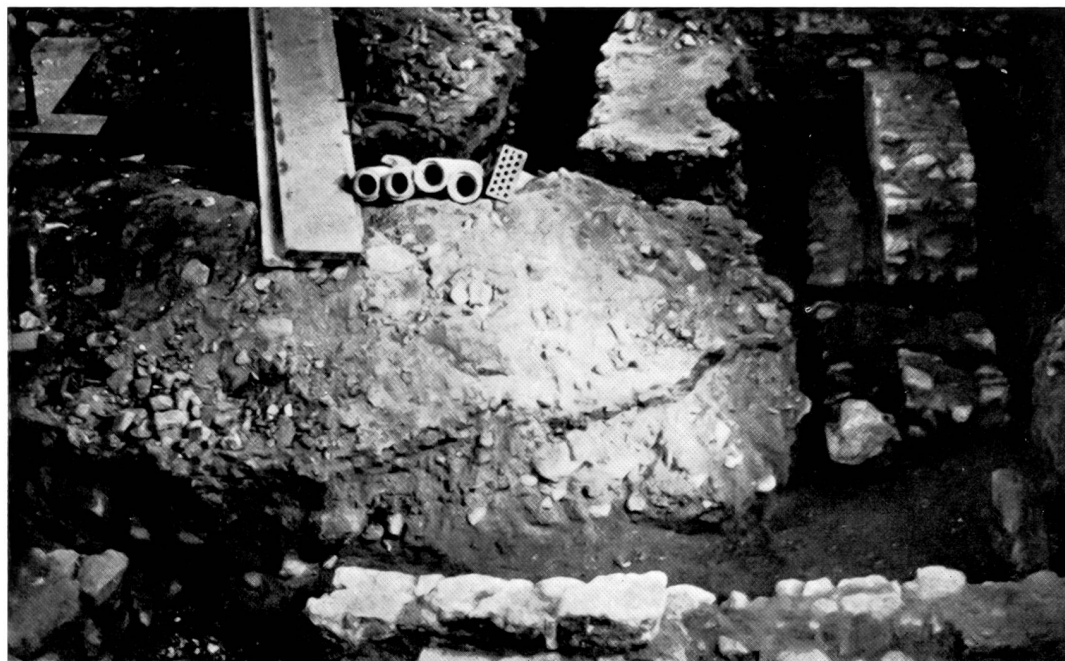
Abb. 6, Westabschluss der alten Kirche vor 1671. Vorne links der schmale Durchbruch. Rechts Südwestecke, darüber Fragmente der Türschwelle. Am rechten Bildrand Südmauer mit Fundamentverbreiterung («Wandbank»), oben der Stipes des Wendelinsaltars (rechter Seitenaltar).

Da die Brunst von 1812 die Ausstattung der Kirche ziemlich weitgehend zerstört haben muss, ist man vorläufig, solange nicht etwa aus den Akten des Stifts Schönenwerd noch mehr erfahren werden kann, auf folgende Anhaltspunkte angewiesen: In der Apsisrückwand waren oben beim Gewölbeansatz zwei in die Wandfläche umgebogene Eisenstangen eingemauert, die zweifellos einmal das Retabel eines Altars abgestützt hatten. Über dem linken Seitenaltar (bis jetzt Marienaltar) fand sich in der Chorbogenmauer eine nischenartige Vertiefung, die eine Figur oder Figurengruppe enthalten haben muss. Dieser Seitenaltar ist im Jahrzeitenbuch von 1525 (also schon für die «Vorgängerin») als Altar der heiligen Vitus, Modestus und Crescentia genannt. Er ist es sicher noch 1772, da Pfarrer Peter Joseph Gyonet von Riedholz, der sich im Jahrzeitenbuch immer Coelestinus nennt, daselbst schreibt, er habe auf eigene Kosten den Vitusaltar