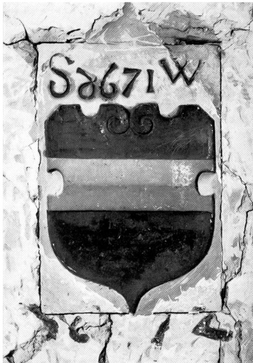
Abb. 2, Schlussstein im Chorgewölbe (1671)