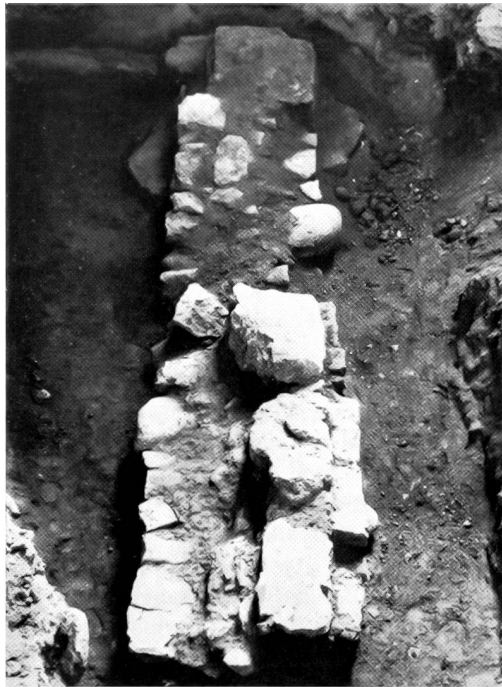
Abb. 7, Westmauer der alten Kirche. Oben links Türschwelle.