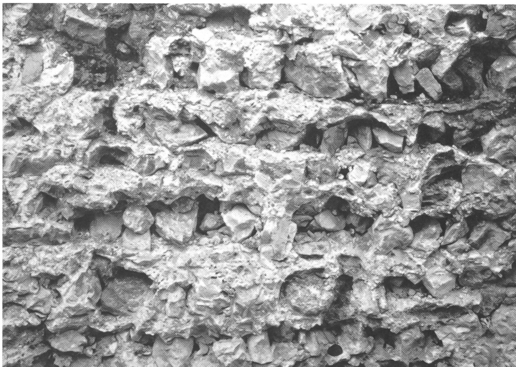
Olten, Klosterplatz Nr. 15. Beim Abbruch der Castrummauer zeigt sich im Querschnitt deutlich der lageweise Bau.

März 1968 für das Kellergeschoss des neuen Wohn- und Geschäftshauses der Baugrund ausgehoben. Wie erwartet, kam die Castrummauer zum Vorschein. Von der Baugrube her war ihre Innenseite auf einer Länge von nahezu 20 m zu sehen. Es dürfte das erstmal – und wahrscheinlich auch das letztmal – gewesen sein, dass in der Neuzeit ein so grosses Stück der Castrummauer freilieg. Mit etwas Phantasie konnte man sie sich leicht noch einige Meter höher und von der Aare her bis gegen das ehemalige obere Tor verlaufend vorstellen und so einen Eindruck von den Ausmassen der spät-römischen Befestigung gewinnen.