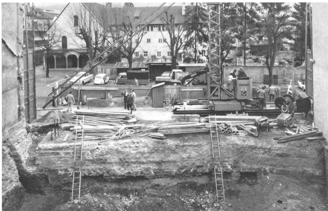
Olten. Die Innenwand der spätrömischen Castrummauer ist vom links angrenzenden Restaurant «National» bis zum Kaufhaus Klosterplatz im Osten sichtbar.