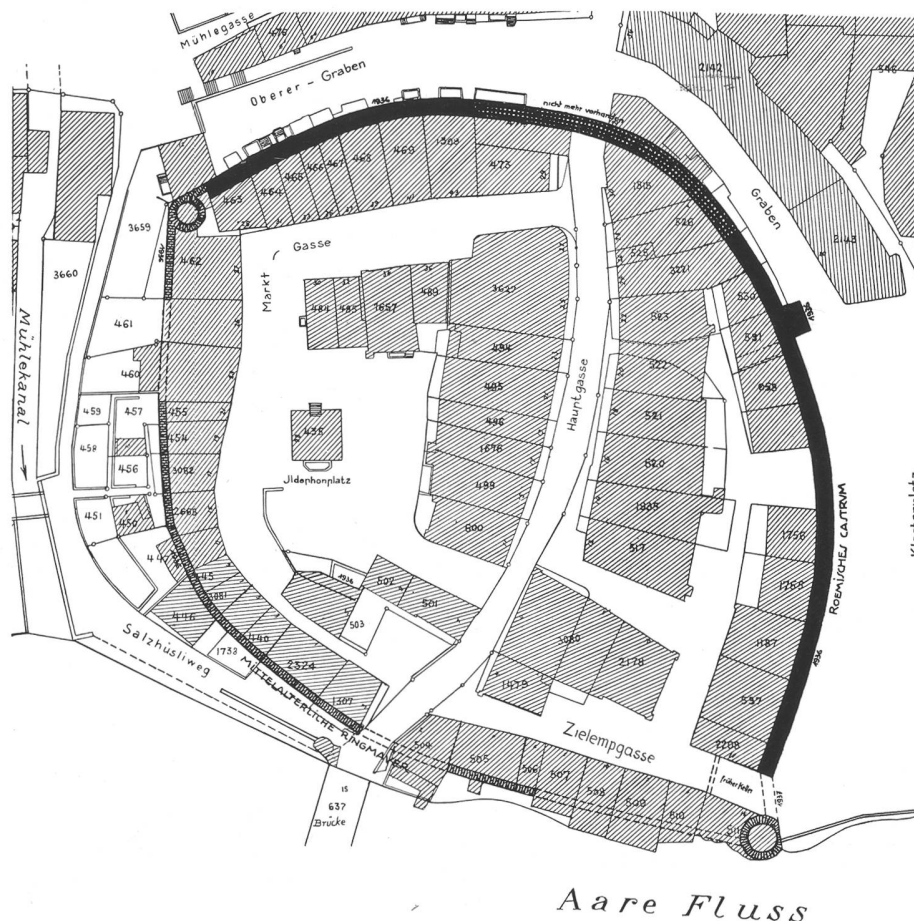
Olten. Castrum, nach der Aufnahme von Häfliger und Rein (Festschrift Eugen Tatarinoff, 1938, S. 38).

Die Bedeutung der Region Olten für die Besiedlung ist durch die topographische Lage gegeben. Der Jurasüdfuss, der Flusslauf der Aare und die relativ günstige Möglichkeit, an dieser Stelle das Juragebirge zu überwinden, bilden die entscheidenden Faktoren. Feuersteingeräte bezeugen, dass die Gegend von Olten bereits in der Altsteinzeit besiedelt war. In den folgenden Epochen wird der Platz stets wieder belegt. Siedlungsgeschichtlich entscheidend ist erst die helveto-römische Zeit. Im verflossenen Jahr bereicherten Bauarbeiten im Gebiet der Altstadt die Kenntnisse über das römische Olten wesentlich. Die Auswertung der archäologischen Funde ist noch nicht abgeschlossen. Gleichwohl sollen im folgenden einige neue Resultate mitgeteilt und mit Bekanntem in Beziehung gesetzt werden.