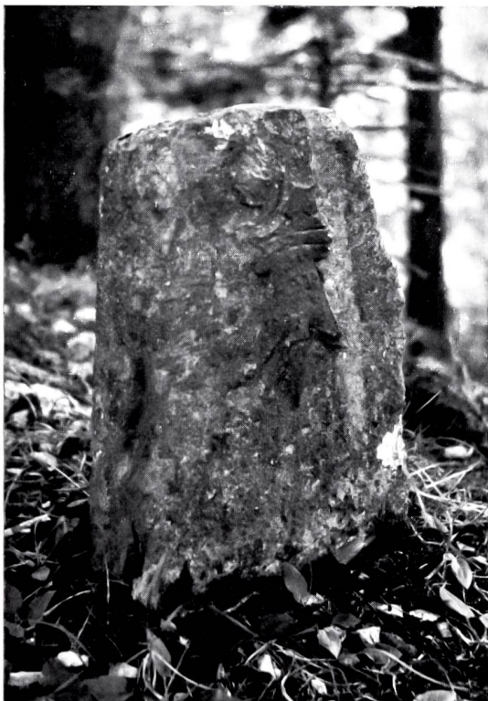
Bild 1: Grenzstein Nr. 159 aus dem Jahre 1531 auf der westlichen Gwidemflue in der Nähe des Spaleneggli.

Es handelt sich um Dreiecksteine von ansehnlichen Ausmassen. Sie tragen, um den überstumpfen Winkel des Grenzverlaufes gegen Norden besonders deutlich zu markieren, je 2 Hoheitszeichen des Standes Basel und 1 Solothurner Wappen. Aus den eben erwähnten Jahren sind noch einzelne andere Steine vorhanden. Bekannt ist Nr. 163 in der Gegend des Sonnenberges an der Belchen-Südstrasse (Bild 3). Der exponierten Lage wegen wurde er leider von parkierenden Autos oftmals angefahren und stürzte schliesslich um. Fast 300 Jahre lang versah er den Dienst. Im vergangenen Herbst ist ein Nachfolger aus Granit mit der Jahrzahl 1971 an seiner Stelle in «Amt und Würde» eingesetzt worden.