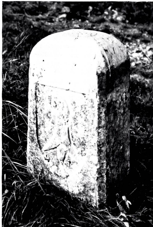
Bild 4: Grenzstein Nr. 238 aus dem Jahre 1834 im Balmis (Schafmatt).