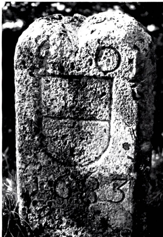
Bild 2: Dreieckstein (Nr. 161) mit 2 Hoheitszeichen des Standes Basel und 1 Solothurner Wappen auf dem Ruchen (westlich der Belchenflue). Er trägt die Jahrzahl 1683.

Von den 80 Marksteinen im Abschnitt Belchen-Schafmatt erinnert eine grosse Anzahl an die Grenzvereinbarungen der Jahre 1825 und 1834 (Bild 4). Auffallend sorgfältig sind bei diesen Brocken die Felder im Solothurner Wappen wie auch Krümmung, Knauf und Lappen des Baselstabes herausmodelliert. Die einzige Ausnahme in bezug auf Wappenschmuck ist der Stein Nr. 162 vom Jahre 1882 im Belchensattel, ausgerechnet an einer Stelle, die im Verlauf eines Jahres Hunderte von Wanderern passieren. Die Bezeichnung SO und BL ist alles, was er zu bieten hat. Den