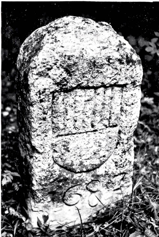
Bild 3: Grenzstein Nr. 163 aus dem Jahre 1683 in der Gegend des Sonnenberges an der Belchen-Südstrasse. Er wurde im Herbst 1972 durch einen neuen Stein aus Granit mit der Jahrzahl 1971 ersetzt.

Spannungen waren entstanden, nachdem der Ritter Thomas von Falkenstein 1461 die Landgrafschaft Sigsau an Basel abgetreten hatte, wobei er die Grundherrschaft des Dorfes Wisen den Solothurnern, die hohe Gerichtsbarkeit aber den Baslern übergab. Solch verwickelte Rechtsverhältnisse führten zu ständigen Reibereien, denn die Leute von Wisen mussten für Malefizsachen in Basel erscheinen (der Galgen stand in Muttenz), in Angelegenheiten aber, die dem niederen Gericht zufielen, sich in Olten verantworten. Diese Doppelpurigkeit blieb bis ins letzte Jahrhundert bestehen, und erst 1825 willigte Basel unter dem Vorbehalt anderer Grenzvereinbarungen ein, seine Rechte an Solothurn abzutreten. Die Unterhandlungen kamen jedoch nicht recht vom Fleck und stockten schliesslich während der «Basler Wirren» der dreissiger Jahre. 1839 konnte Solothurn endlich, nunmehr mit dem neuen Kanton Baselland, das Protokoll über die Grenze am Wisenberg unterzeichnen. Die neuen Steine, die ausser dem Solothurner Wappen einen nach links gerichteten Baselstab ohne Krabben aufweisen, wurden schon 1834 aufgestellt, weil zu diesem Zeitpunkt bereits abgesprochen war, was Solothurn für seinen Gebietszuwachs bei Wisen an Kompensation zu lei-