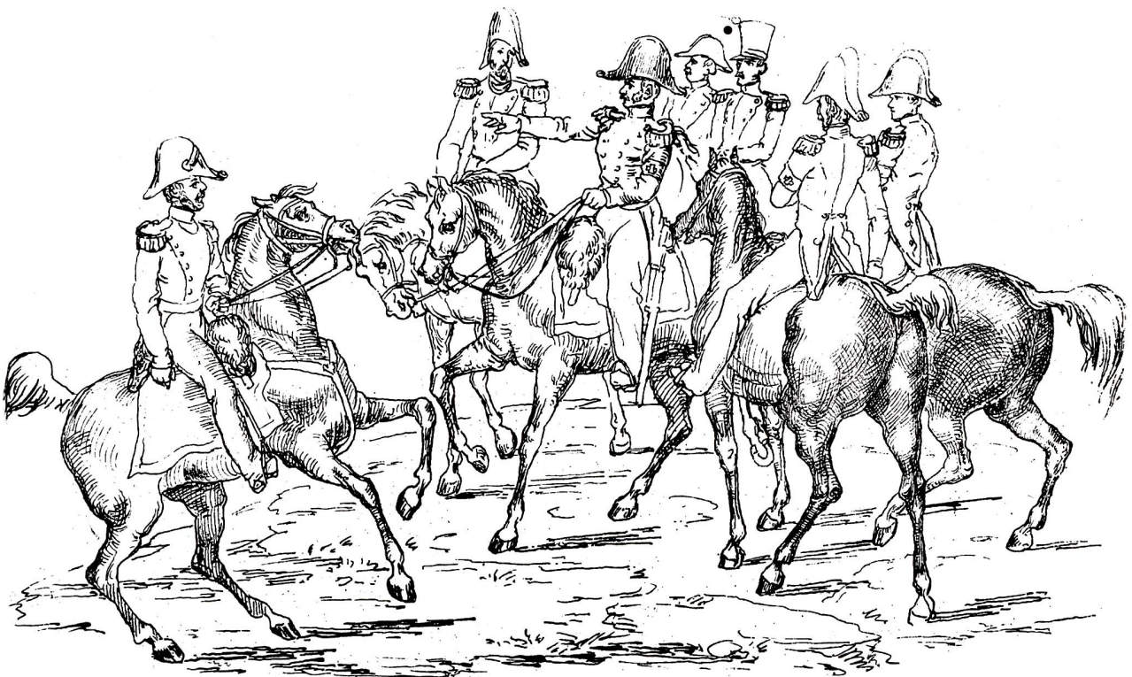
Die – grün uniformierten – eidgenössischen Stabsoffiziere in Sursee, auch sie mit der eidgenössischen Feldbinde am Arm. In der Mitte gut erkennbar Oberst David Zimmerli, links aussen Martin Disteli. (Schweizerischer Bilderkalender 1845. Das Original im Kunstmuseum Solothurn, eine Skizze im Kunstmuseum Olten.)