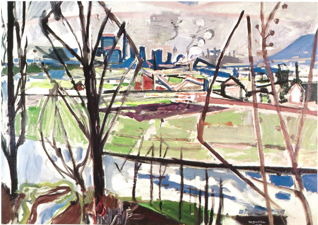
Gubler Max Vorfrühling, 1953 Kunstmuseum Olten