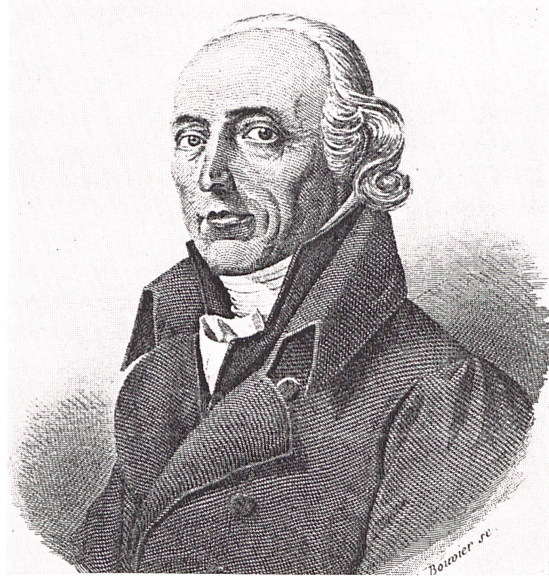
Johann Conrad Escher von der Linth