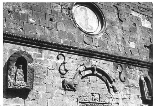
Ausschnitt aus der Westfassade der 1525 zerstörten Klosterkirche

die sich auch auf einen Teil des Waldes zwischen Langenbruck und Onoldswil erstreckte. Dieser Forst lag auf ihrem Gebiet, hatte aber zum Sprengel der Kirche St. Peter in Onoldswil (zwischen Ober- und Niederdorf) gehört. Sie verlangte nun den Zehnten vom Ertrag des auf-gebrochenen Landes, den sogenannten Neubruhzehnten, nach altem kirchlichem Recht. So kam es schon bald nach der Gründung zu Streitigkeiten, denn die Mönche weigerten sich, die Abgabe zu entrichten, indem sie sich auf die von den Froburgern gewährte Steuerfreiheit beriefen. Darauf brachte der Pfarrer von Onoldswil den Konflikt bis vor den päpstlichen Stuhl in Rom, wurde aber abgewiesen. Bischof Ortlieb gab in seiner Urkunde die Entscheidung des Papstes bekannt. Allein der Priester belästigte weiterhin die Mönche von Schöntal, bis im Ein-vernehmen mit Graf Ludwig von Froburg, dem Vogt der Kirche Onoldswil, ein Vergleich zu-