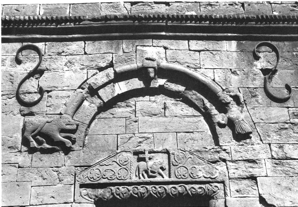
Figureschmuck über dem Portal: Lamm Gottes mit Kreuz, Rittergestalt und Löwe

umschrieben. Zahlreiche Hofstätten mit zugehörigem Ackerland werden aufgeführt, Nutz-