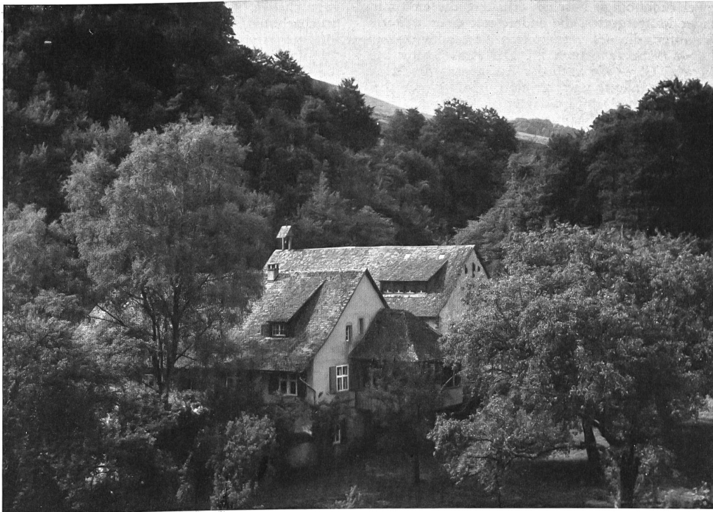
Schöntal von Südosten. Das ehemalige Kloster liegt in einem Seitentälchen am Obern Hauenstein in einer Mulde eingebettet

hörte einstmals zur Klosterkirche und stellt «das älteste erhaltene rein romanische Bauwerk der Schweiz dar», wie der illustrierte Führer des Kantons Baselland vermerkt. Die markante, nunmehr leider stark verwitterte Eingangsseite besteht aus grossen Quadern und wird durch ein Gurtgesimse zweigeteilt, wobei in der untern Partie das Portal die Aufmerksamkeit des Betrachters unwillkürlich auf sich lenkt (Bild 3). Aus den feingliedrigen Blattornamenten am Sturzstein tritt deutlich das Agnus Dei, das Lamm Gottes, hervor, auf dessen rechtes Vorderbein sich das Kreuz stützt. Ein wulstartiger Halbrundbogen, getragen von einer Rittergestalt und einem Löwen – Symbole des Guten und Bösen – bildet einen weiteren Abschluss des Portals. Die auf dem