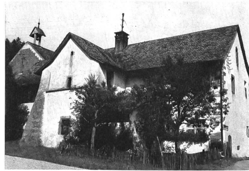
Meyerhaus mit dem Rest des durch Strebepfeiler gestützten Turmes

einem Enkel des Stifters. Er räumte mit allem auf, was nicht der Regel des heiligen Benedikt entsprach, hielt die Mönche zu strenger Zucht an und forderte Disziplin in der monastischen Tagesordnung. Ferner wandte er sich an das Kapitel in Basel und erreichte, dass der Bischof die alten Schenkungen, insbesondere auch die Verfügung Ortliebs über die Zehntenfreiheit bestätigte. Graf Hermann selbst bedachte das Kloster mit Vergabungen und Stiftungen, worauf auch etliche der froburgischen Ministerialen seinem Beispiel folgten.