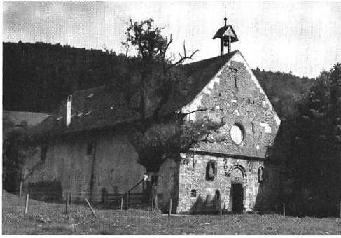
Schöntal von Nordwesten mit der romanischen Fassade

Scheitel des Wulstes ruhende Figur ist nicht mehr zu erkennen (Bild 4).