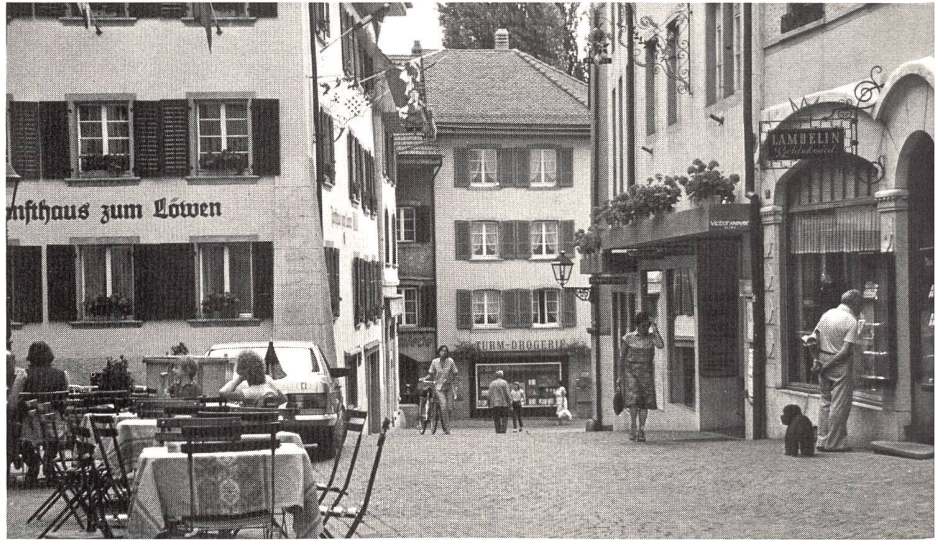
Goldschmiede-Geschäft Lambelin, links Stühle des Restaurants Kreuz