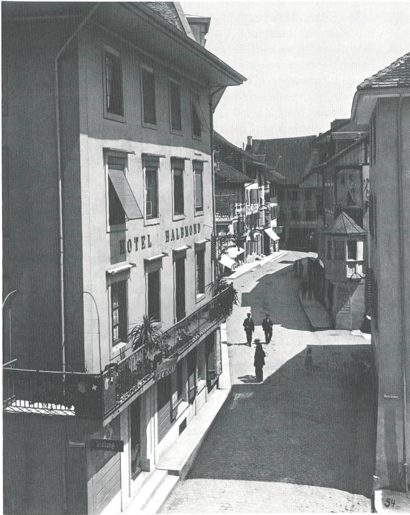
Blick in die Hauptgasse um 1910. Im Vordergrund das Hotel zum Halbmond, in dessen Räumen ab 1918 das Café Strub eröffnet wurde. Das Haus mit dem legendären Erker beherbergte damals noch die Conditorei Charles Mattbey (später Conditorei Max Altermatt, heute Jelmoli-von Felbert). Mit dem Abbruch der drei Häuser unterhalb des einstigen Oberen Brunnens und der Erbauung des heutigen Warenhauses glaubte man um 1930 neue Massstäbe zu setzen!

fetdame alle Hände voll zu tun hatte, die gebrauchten Filter zu leeren und zu waschen. Ein Arbeitsaufwand, der heute undenkbar wäre!