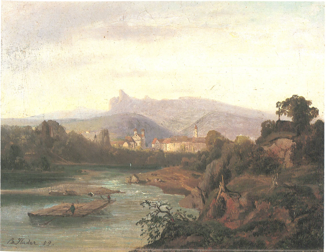
Olten von der Klostertal her, Ölbild von Bernhard Studer, 1859.

routinierten Zeichner schliessen lässt, wird James Cockburn zugeschrieben, einem englischen Offizier, welcher 1859 die Schweiz bereist haben soll. Schon 1981 erschien in den «Neujahrsblättern» eine alte Oltner Vedute, welche Cockburn zugeschrieben wurde. Allerdings ist dieses Aquarell mit einer interessanten Ansicht einiger Häuser «ennet der Aare» (Cen-