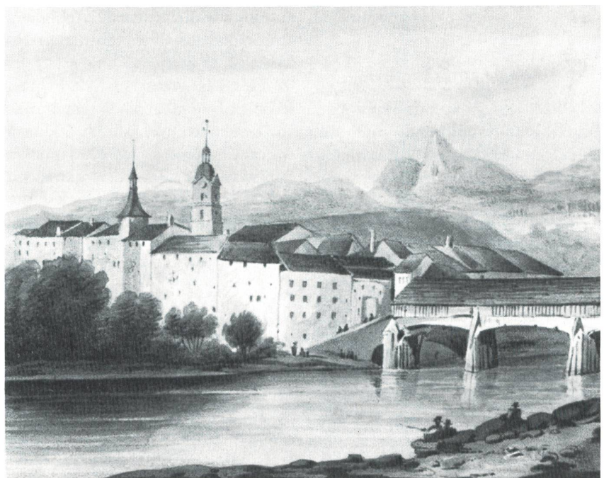
Olten, farbige Lithographie, gezeichnet von Pierre-Luc Ciceri, lithographiert von G. Engelmann, 1828.

routinierten Zeichner schliessen lässt, wird James Cockburn zugeschrieben, einem englischen Offizier, welcher 1859 die Schweiz bereist haben soll. Schon 1981 erschien in den «Neujahrsblättern» eine alte Oltner Vedute, welche Cockburn zugeschrieben wurde. Allerdings ist dieses Aquarell mit einer interessanten Ansicht einiger Häuser «ennet der Aare» (Cen-