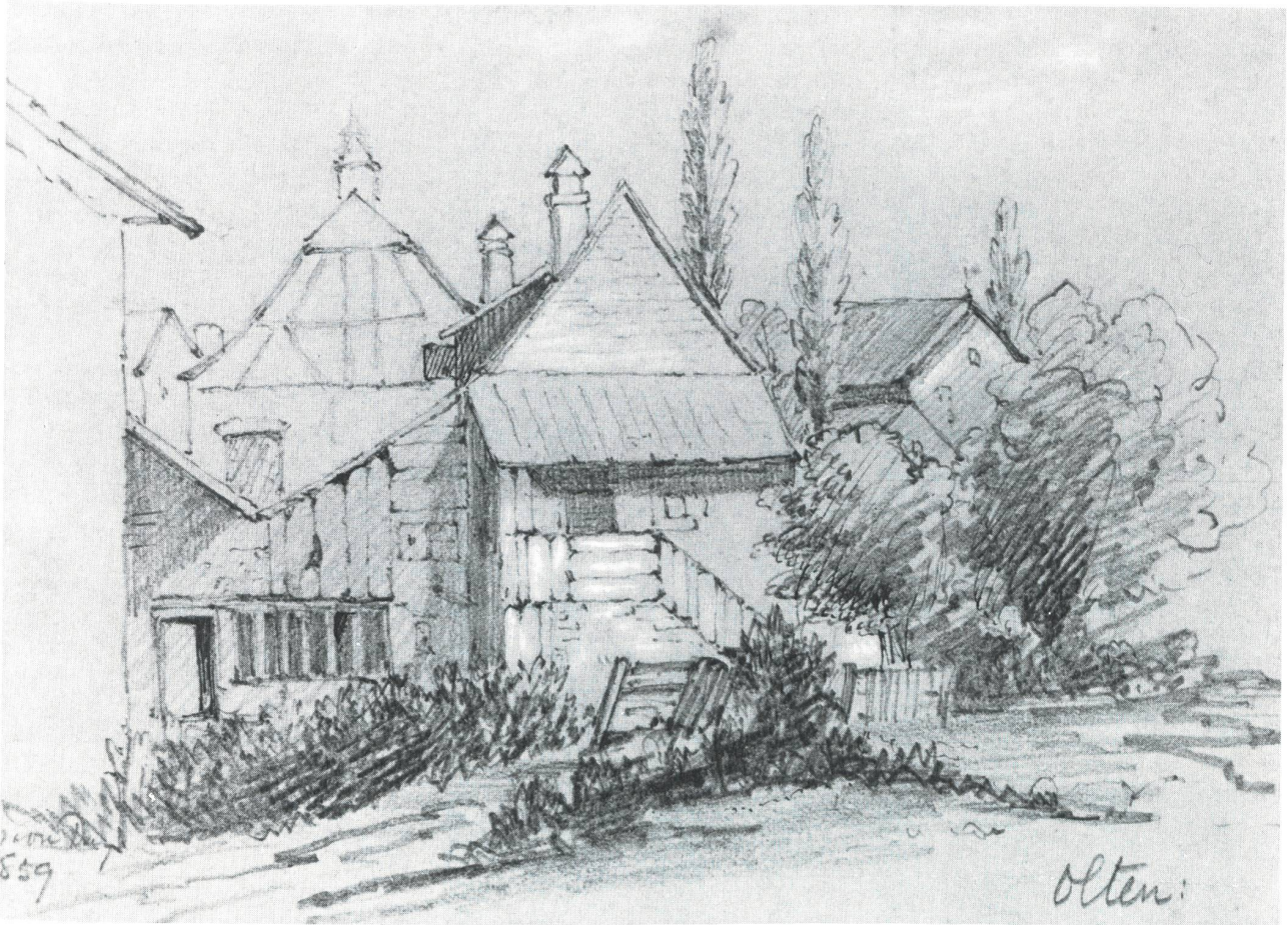
Blick auf das alte Hübeliquartier, Zeichnung (James Cockburn zugeschrieben), 1859.