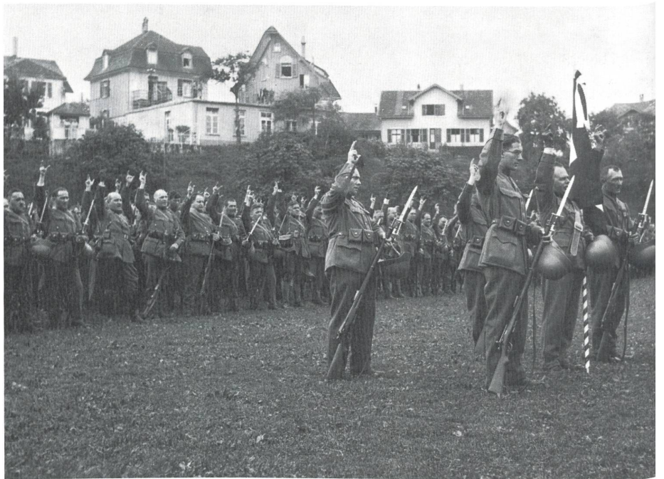
Das Terr Bat 139 musste am ersten Tag der Mobilmachung, am 1. September 1939, um 16 Uhr auf der Schützenmatte in Olten einrücken. Der Eid auf Fahne und Vaterland wurde am 2. September geleistet.

Ganz schön leuchtet die Kameradschaft auf im Erinnerungsbuch des 1. Zugs der damaligen Terr Füs Kp II/177, dem wir einige Illustrationen des damaligen Oltner Primar- und späteren Seminarlehrers und Künstlers Otto Wyss entnommen haben. Der Solothurner Dichter Cäsar von Arx hatte für seine Kameraden sogar ein