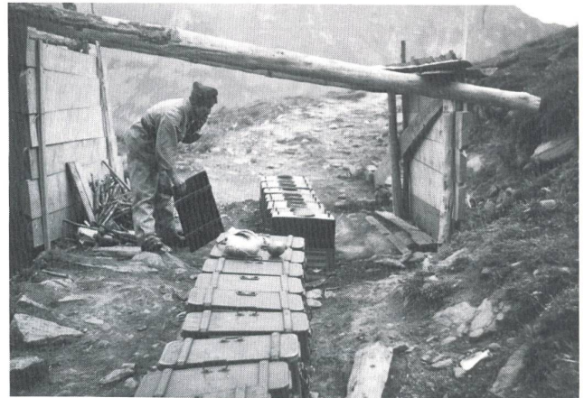
Feldküche auf Ettenberg.

Nerven zu behalten. So wie Vater. Aber, das belehrte mich die nächste Begegnung mit dem Manne, der sich in diesem Augenblick doch wohl als der «Übermann» der Gemeinde hätte beweisen müssen, mit dem Ammann nämlich, dass Memme ein Wort sowohl weiblichen wie männlichen Geschlechts sein musste. Kaum hatte ich den Anschlagkasten, aus dem nun das Mobilmachungsplakat zum Einrücken aufrief, geschlossen, stolpert neben mir die überforderte Seele von Gemeindevorsteher beinahe vom Rad und wollte auch sein Exemplar des Plakates noch aufhängen, obgleich die angeheftete Weisung dieses deutlich als Duplikat zur Kenntnis der Gemeindebehörde auswies. Ein guter und menschenfreundlicher Ingenieur und Beamter für «normale Lagen». In ausserordentlichen würde er gewiss nicht bestehen. Zu wissen, dass auch mit solchen Amtsträgern zu rechnen war, mochte für die Zukunft gut sein. Zu Hause Abschiedsstimmung. Ob ich Vater und Mutter bis zu dieser Stunde je Hand in Hand nebeneinander auf dem Kanapee sitzend gesehen hatte...? Und jetzt weinte auch Mutter still vor sich hin. Mir war es peinlich. «Und nach 25 Jahren das Ganze noch einmal», unterbrach Vater die Stille und hiess mich die Zeitung heraufholen, die unten eben in den Kasten gefallen war. Eine ältere Nummer gab es nie! Auf der ersten Seite hatten «Die Vorschläge Hitlers an Polen» den grössten Titel über zwei Spalten erhalten. «Alter Schwindel»,