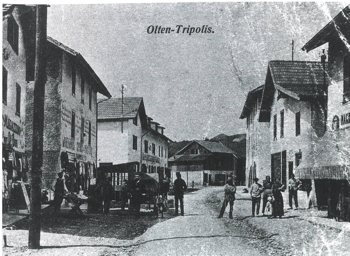
Eine Strassenszene, in der Bildmitte ein Polizist, rechts eine Metzgerei («macellerie»)

Amtshaus zum Bahnhof übergeführt wurden, kam es zu einem grösseren Volksauflauf, und die eskortierenden Polizisten mussten mit dem blanken Säbel um sich schlagen, um so die drohende Menge von einer Lynchjustiz abzuhalten («OT», 6. 7. 1912).