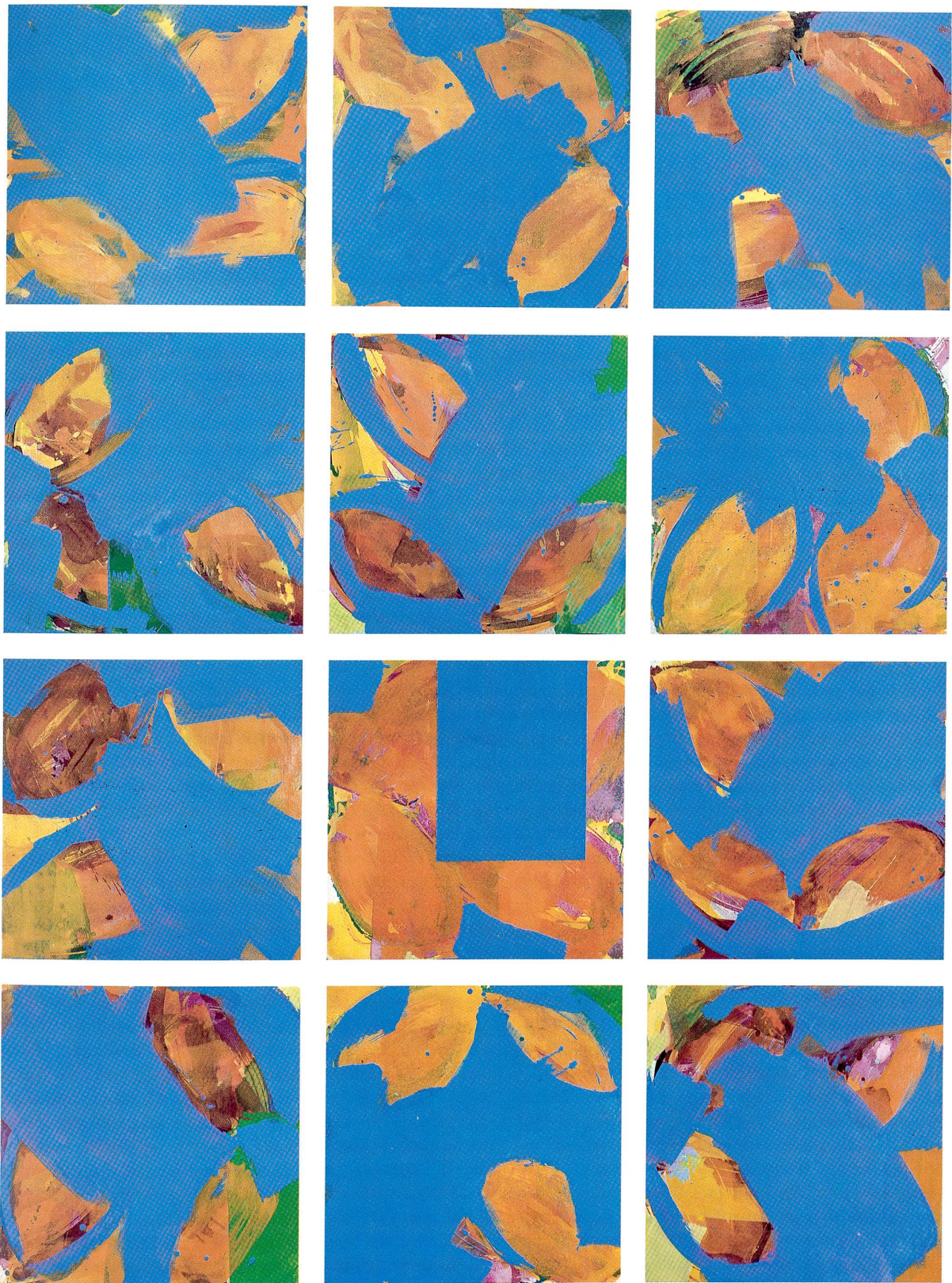
Roland Nyffeler, Domino 4, 12teilig, 1992, Acryl auf Moiré-Stoff, 258 x 192 cm