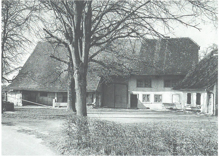
oben: Der Kleinholz-Hof, wie er bis in die Mitte des 20. Jahrhunderts noch bestand.

Ob allerdings die «Husmatt» schon immer so geheissen hat, ist nicht so sicher. Eigenartigerweise nämlich ist der Flurname «Husmatt» erst im Grundbuch von 1825 erstmals nachzuweisen. 1 Dies scheint um so unverständlicher, als der Husmatt-Hof – wie sich das unschwer anhand von Plänen und alten Ansichten belegen lässt – mit Sicherheit älter war als der Kleinholz-Hof. Eine mögliche Erklärung für diesen Umstand bietet die Annahme, der Name «Husmatt» sei eventuell als Verschrieb zu deuten. In alten Quellen findet sich nämlich am gleichen Standort, auf der sogenannten «Hurd uffem Stadreyn» die «Hurdmatt». 2 Die «Hurd» aber, das machen die Beschriebe in den alten Urbaren klar, war ursprünglich ein Stück Land, das vom Kleinholzweg bis hinunter an die Olkenmatt 3 an der Dünnern reichte. Vom Kleinholzweg heisst es, er gehe von dem «Kleinholtz» zur «Leimgrueben». Diese Situation Husmatt (oder Hurdmatt)/Kleinholz ist übrigens noch im Pfändlerplan von 1868/69 eindeutig belegt. Dass derartige Namensänderungen infolge von Verschrieben in Grundbüchern durchaus möglich sind, zeigt etwa der Umstand, dass noch im ausgehenden 19. Jahr-