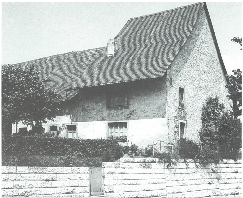
unten: An den einstigen Husmatt-Hof erinnert heute nur noch die monumentale Stützmauer am Hausmattrain.