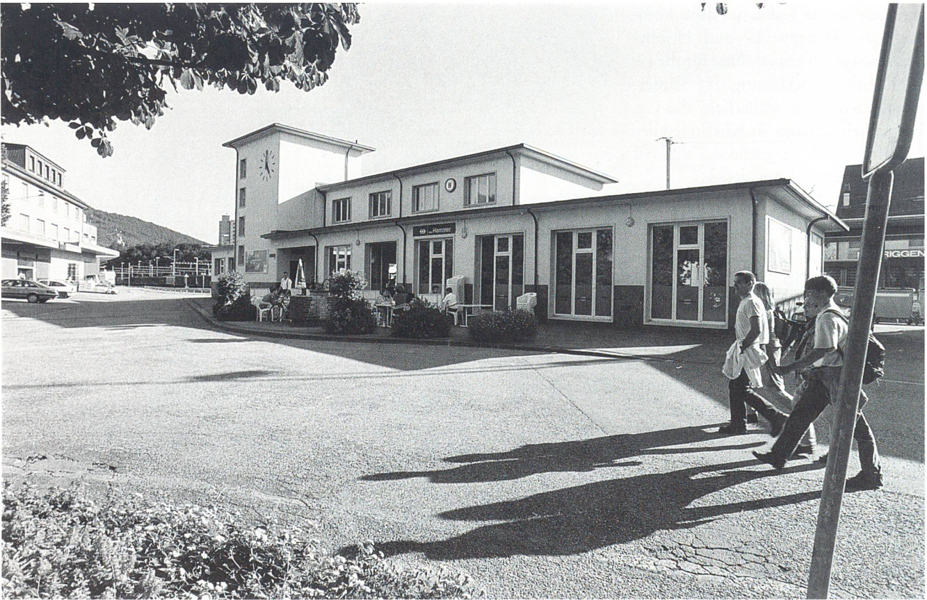
Der Bahnhof Olten-Hammer wurde zur Beiz, mit Bar und Bühne!