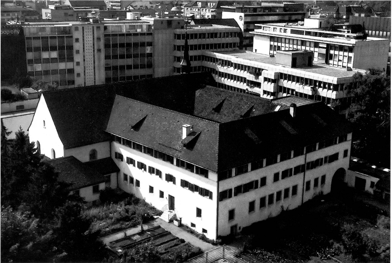
Das Kloster stand 300 Jahre am Rande der Altstadt. Jetzt liegt es wie eine Verbindungsbrücke zwischen Alt- und Neu-Olten.

schon Museum). So konnten die Kapuziner 1648 einziehen. Das Unternehmen fand seine Krönung mit der Einweihung der Kirche am 10. Oktober 1649.