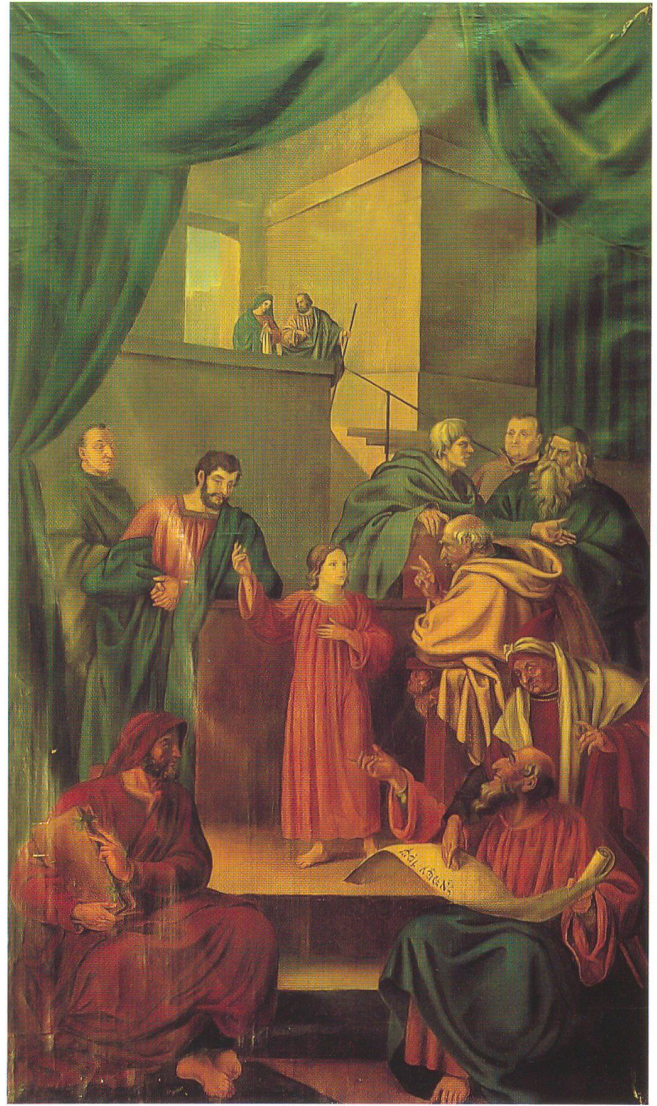
Disteli, Martin. Der 12jährige Jesus im Tempel . 1834/35. Öl auf Leinwand. 231x137 cm. Olten, Kunstmuseum (ursprünglich Altarbild für die katholische Pfarrkirche St. Barbara, Kappel)

Zeitgenossen verwendet, und Gutzwiller hat sie teilweise übernommen. Es erstaunt nicht, dass nach der Legende bekannte Oltner Bürger auf dem Bild portraitiert seien, umso weniger, als Disteli ja bereits in Kappel «satyriert» habe.