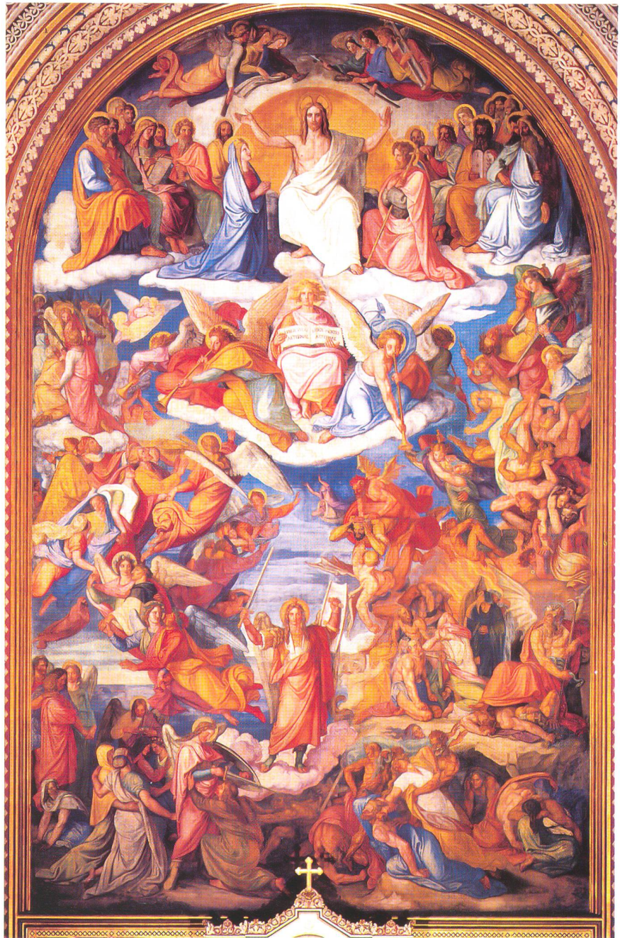
Cornelius, Peter. Das Jüngste Gericht. 1840. Fresko, München, St. Ludwig (Chorwand)

Die Tuschezeichnung unterscheidet sich wenig von dieser Tintenskizze. Sie ist künstlerisch am bedeutendsten: kräftig, schwungvoll, gekonnt gezeichnet, in den Details ziemlich fein ausge-