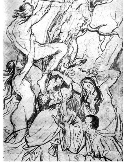
Oben: Disteli, Martin. Ausschnitte aus dem Karton zum Jüngsten Gericht. 1843. Tusche. Olten, Kunstmuseum.