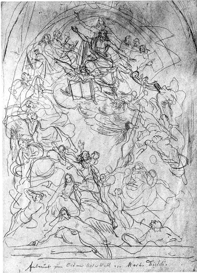
Disteli, Martin. Skizze zum Jüngsten Gericht. 1843. Bleistift, 28 x 21 cm. Olten, Kunstmuseum, Di J-44