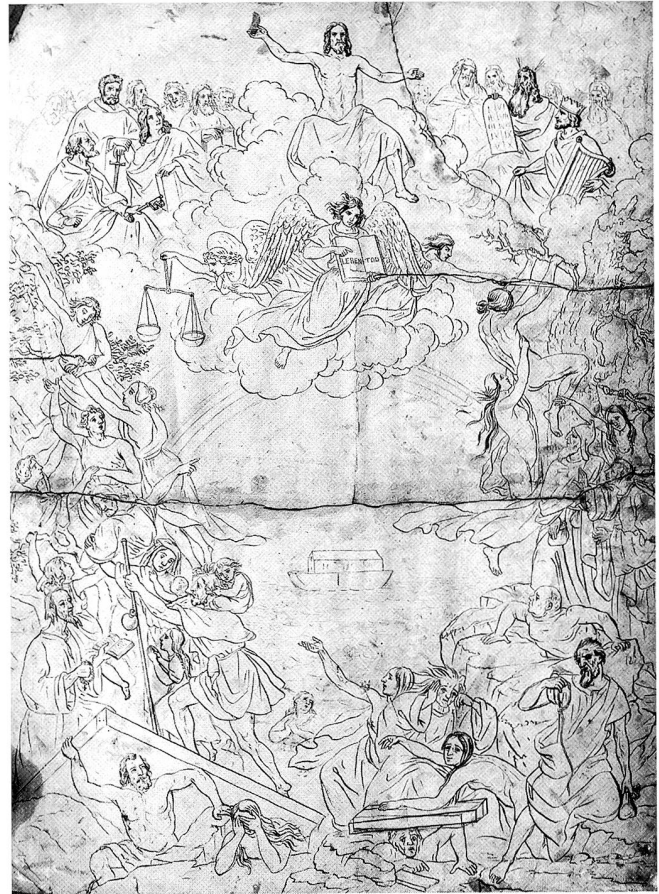
Disteli, Martin. Das Jüngste Gericht. 1843. Feder, 58 x 44 cm. Olten, Kunstmuseum, Di J-46

wissen wir nichts, aber man hat sich offenbar einigen können. Am 11. März 1843 lag jedenfalls schon ein Vertragsentwurf vor, der u. a. folgende Artikel enthielt: