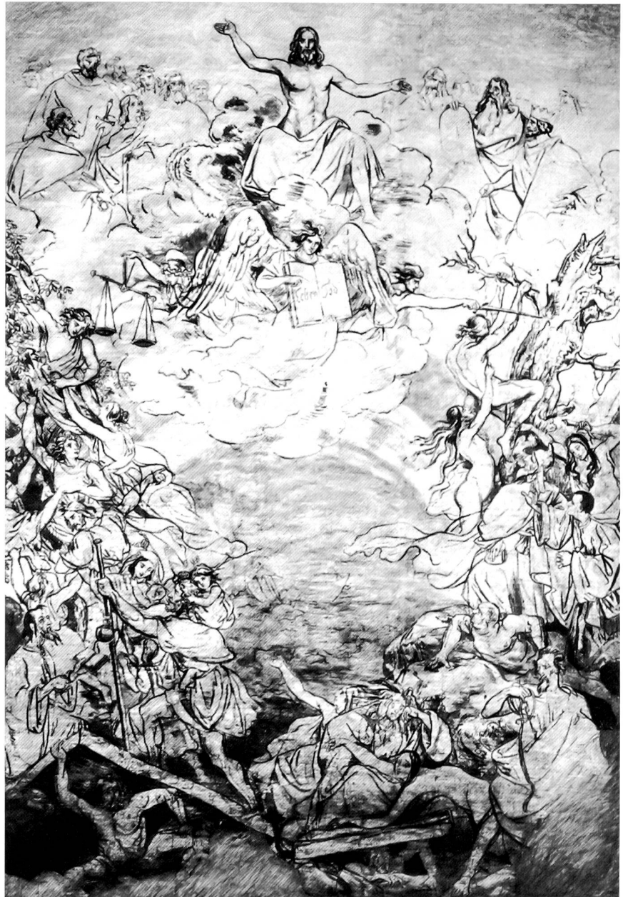
Disteli, Martin. Karton zum Jüngsten Gericht. 1843. Tusche, 578x385 cm. Olten, Kunstmuseum, ohne Signatur

Kurze Zeit nach dem Tod Distelis bewarb sich Gutzwiller um die Ausführung des Altarbildes 4 . Die Altarkommission lud ihn schon am 20. April 1844 zur Begutachtung von Distelis Entwurf und zu Verhandlungen nach Olten ein. Bevor ein Vertrag abgeschlossen werden konnte, musste allerdings die Frage der Finanzierung geklärt werden: Eine ausserordentliche Gemeindeversammlung vom 28. April 1844 beschloss, von den Erben Distelis Fr. 400.– zurückzuerlangen, weil die zweite Zahlung von Fr. 700.– für Tuch und Farben bestimmt gewesen sei, wovon nichts vorhanden sei, und es unmöglich wäre, aus der Restsumme von Fr. 1400.– «die vorhandene Zeichnung gehörig ausführen zu lassen» 4 .