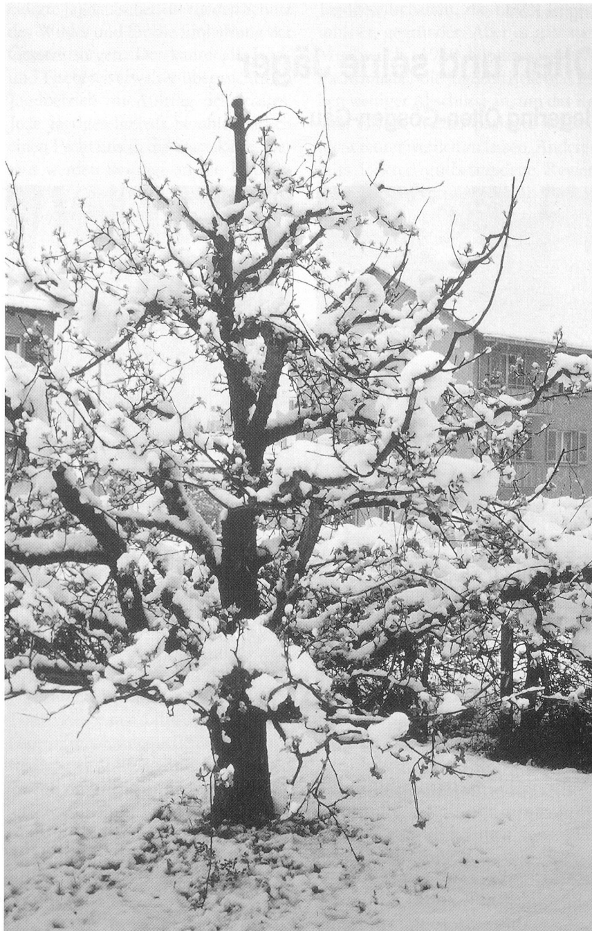
Der Apfelbaum am Ostermorgen vom 12. April 1998 bei der grössten Schneehöhe von 16 cm des ganzen Winters

Der Ostersonntag vom 4. April war um 10,4 Grad und die Osterperiode um 7,8 Grad wärmer als an den kalten und schneereichen Ostertagen des Vorjahres. Gegenüber dem langjährigen Mittel betragen die Abweichungen +5,4 und +4,6 Grad. Während der ganzen Osterperiode 1999 fielen nur 1,3 Millimeter Regen, 7,8 Millimeter weniger als im langjährigen Mittel. Der Ostertag wies nur während 35 Minuten Sonnenschein auf. Die ganze Osterperiode brachte 14,6 Sonnenscheinstunden, was einem Defizit von 5,4 Stunden entspricht. In den Voralpen betrug die Schneehöhe oberhalb 1500 m ü. M., bei besten Schneesverhältnissen für den Wintersport, noch über 1 Meter.