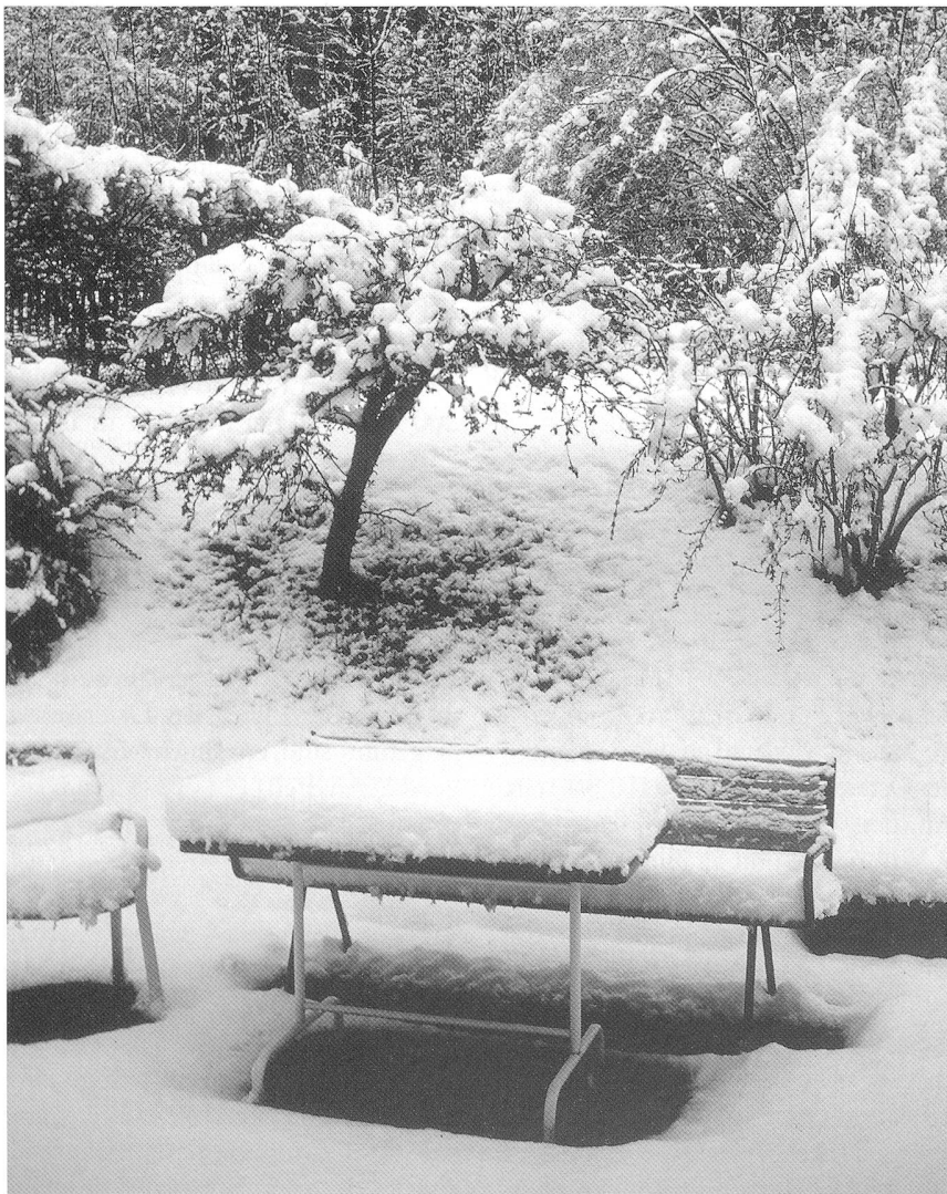
«Weisse Ostern» in Olten am 12. April 1998: Der Gartentisch mit 16 cm Neuschnee

Nach Frühlingswetter, mit Temperaturen von über 20 Grad, kam es zu einem gewaltigen Temperatursturz, wobei in Denver (Colorado) 90 cm Neuschnee fielen.