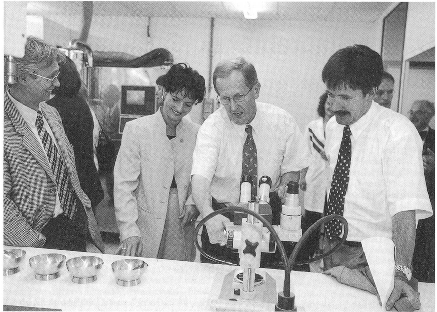
Hober Besuch im Galenik-Labor:

Die Spirig AG hat den klaren Willen zur Selbständigkeit am Unternehmensstandort im Kanton Solothurn zum Ausdruck gebracht. Die Region Olten und der Kanton Solothurn zeichnen sich durch Unternehmensfreundlichkeit aus; der Kontakt zu den Behörden ist offen und unbürokratisch. Olten bietet betreffend Schulung, Erholung und Kultur ein attraktives Angebot.