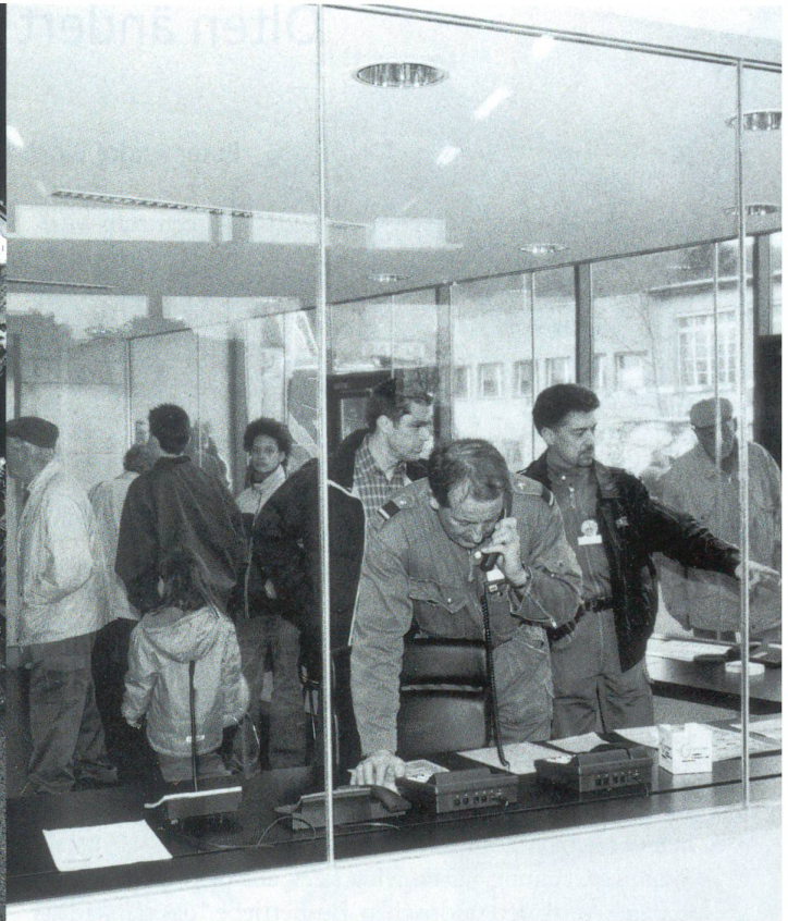
Die neue Einsatzzentrale am Tag der offenen Tür