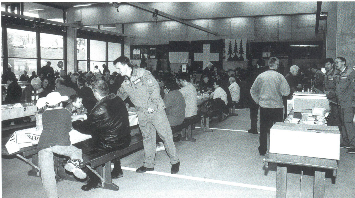
Einweihung des neuen Feuerwehrlokals in Olten