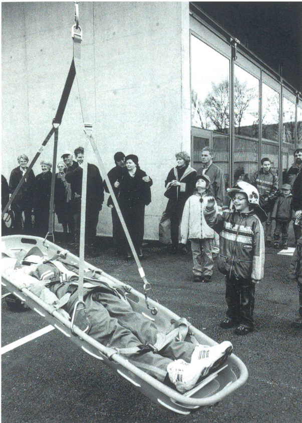
Der «jüngste Feuerwehrmann» der Stadt Olten