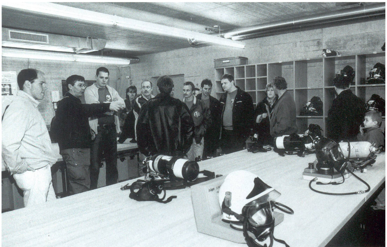
Führung durch den Mannschaftsraum