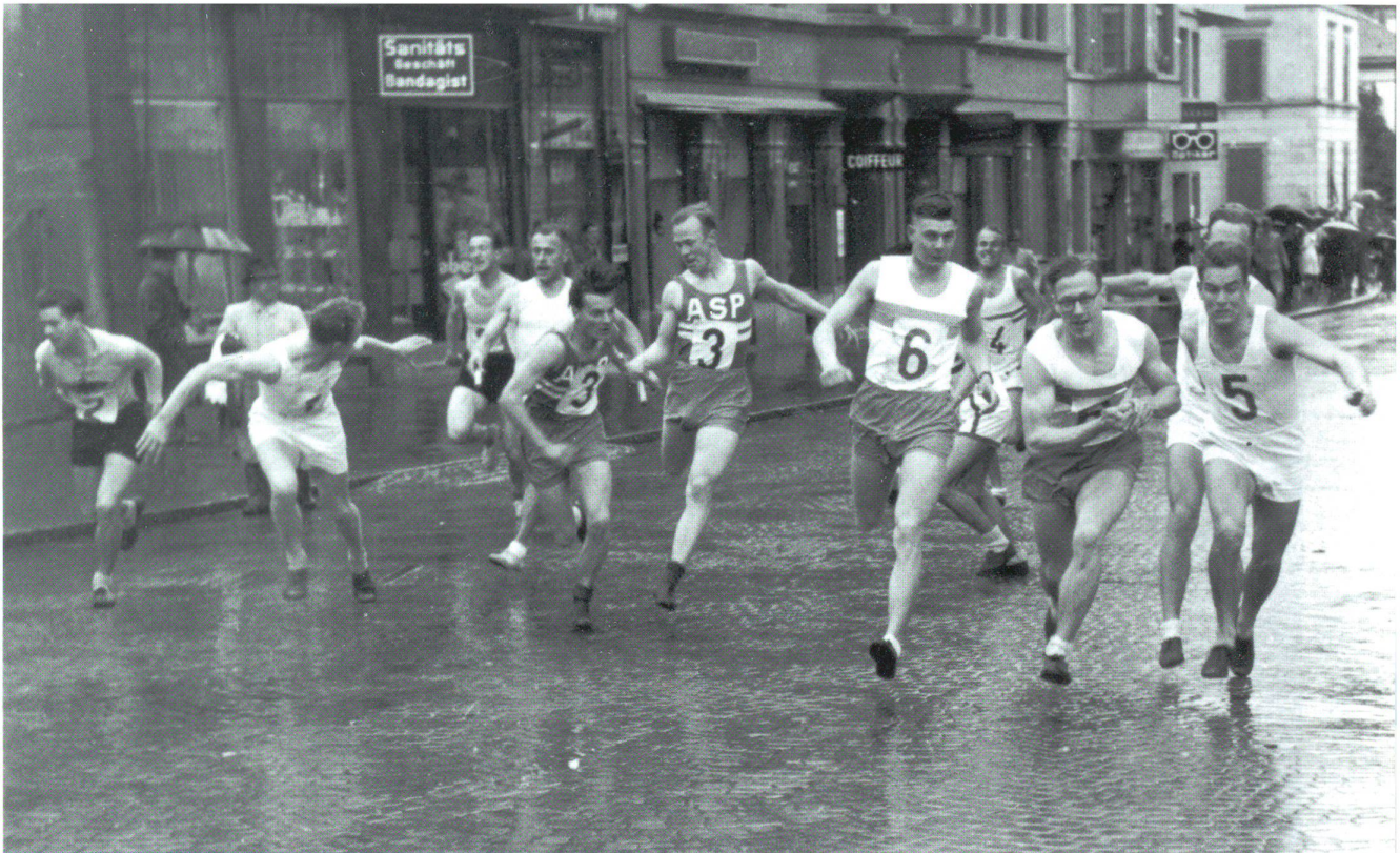
Hart auf hart beim ersten Wechsel

kämpfe auf hartem Asphalt, welche seinen Füessen nicht allzu zuträglich sind...» Allerdings wurde in der Öffentlichkeit die kurz davor aufgestellte Bauwand beim Stadthausneubau als offizieller Grund aufgeführt, welcher zur Absage am Vorabend (!) des Quers führte. Aus Anlass des 125-jährigen Bestehens des TVO wurde 1984 – eigentlich gedacht als Start für eine Wiedereinführung – ein letztes Quer durch Olten durchgeführt. Daran haben mehrheitlich Oltner Sportvereine teilgenommen. Das gezeigte bescheidene Interesse hat die Verantwortlichen des TVO veranlasst, auf den Versuch zur Wiederbelebung des Quers zu verzichten.