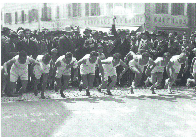
Quer durch Olten 1931

kam anders. Im «Oltner Turner» schrieb der Chronist damals: «Die Organisation des TV Olten lief bereits auf vollen Touren und es klappte alles ausgezeichnet. Leider liess die Zahl der Anmeldungen zu wünschen übrig. Der Schreiber sah diese Entwicklung kommen, denn die goldene Zeit der Strassenstaffelläufe ist endgültig vorbei. Der heutige gute Läufer und Leichtathlet meidet mit Vorteil Wett-