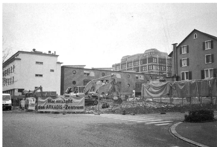
Abbruch des Coop-Verwaltungsgebäudes