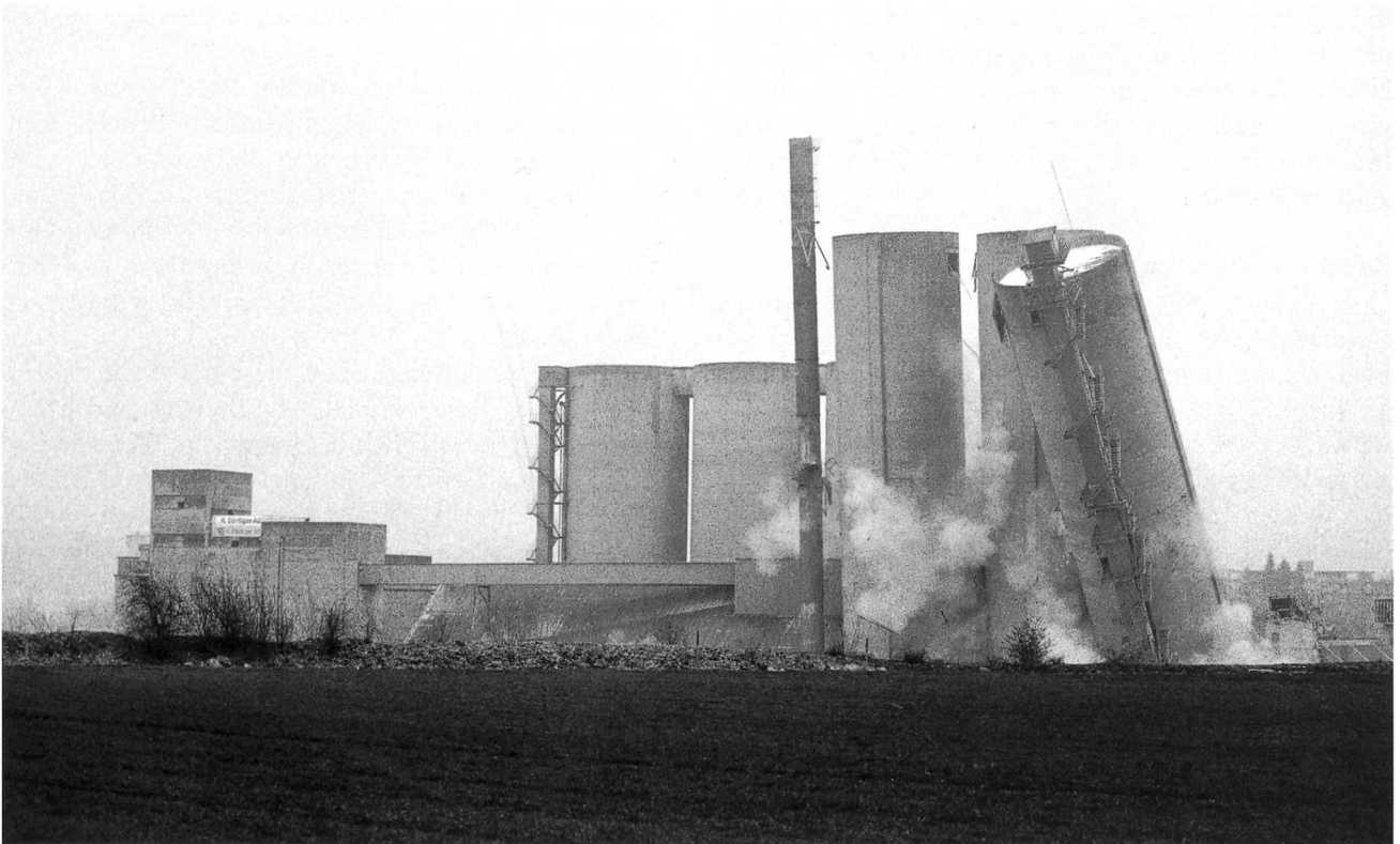
Die versuchte Sprengung der drei grossen Silos in der «Cementi»