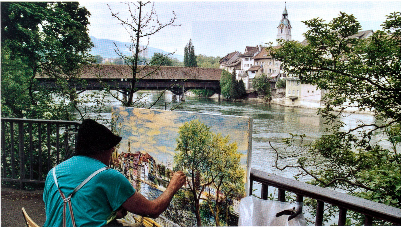
Altstadt: Bild und Abbild