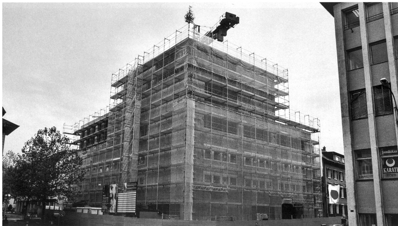
Neubau «Arkadis-Zentrum»: Aufrichte