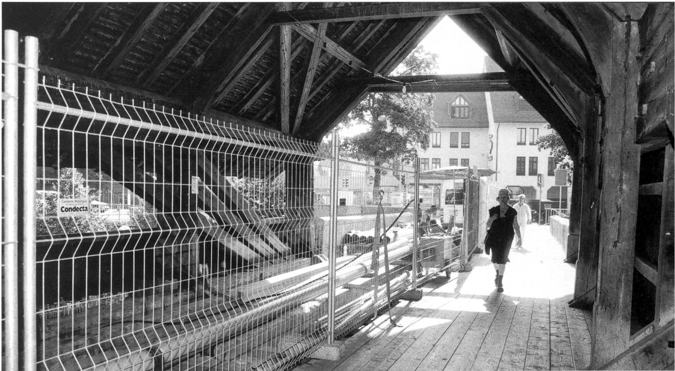
Sanierung der alten Brücke