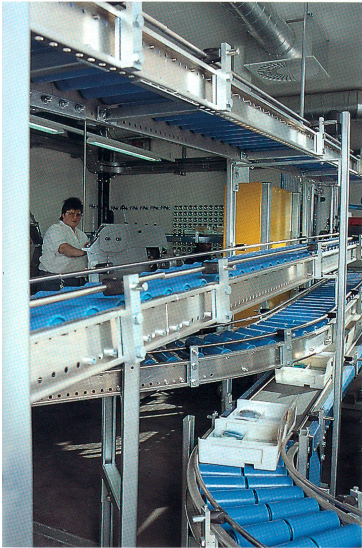
Schnelle, moderne Förderanlagen führen die Aufträge in logisch ausgeklügelter Abfolge von einem Produktionsschritt zum anderen