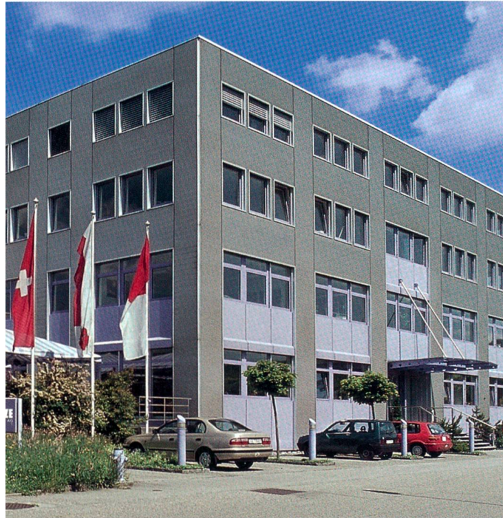
Das hochmoderne Fabrikationsgebäude an der Industriestrasse in Trimbach

Nach Meinung vieler Experten stellen die «KMU», die «Kleinen und mittelgrossen Betriebe», das solide Rückgrat unserer Wirtschaft dar. Tatsächlich gibt es eine grosse Zahl kleinerer und mittlerer Firmen, die sich, oft ausserhalb des Scheinwerferlichts der aktuellen Wirtschaftsberichte, mit sehr viel Einsatz und Erfolg unter schwierigsten Bedingungen am Markt behaupten. Auch in unserer Region könnte man eine ganze Reihe solcher Unternehmen aufzählen. Ein Betrieb, der ohne Zweifel als Musterbeispiel angesehen werden kann, ist die Trimbacher Firma Reize Optik AG , die 2003 ihr 50-Jahr-Jubiläum feiern konnte.