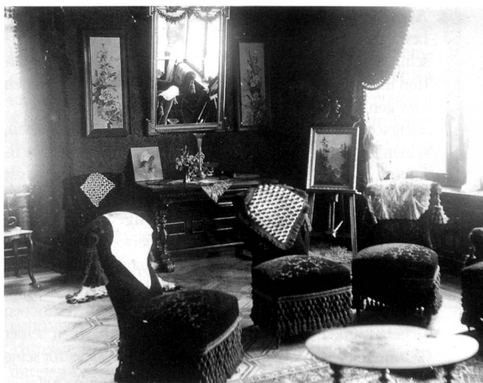
Interieur der Villa Erica