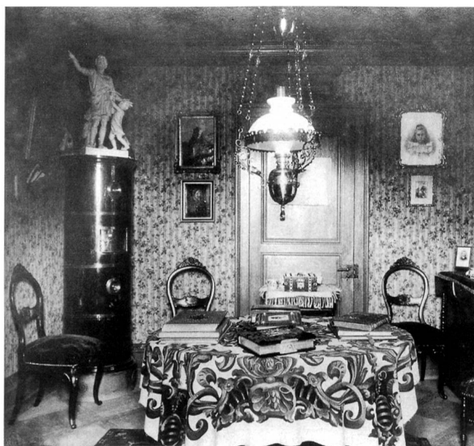
Interieur Chalet Riggenbach

Erst recht bescheiden wirkt das Chalet Riggenbach im Vergleich mit Eduard Ballys Villa Jurablick, die später leider abgebrochen worden ist. Sie bildete übrigens, zusammen mit der Arbeiterkolonie und den 1884 erstellten Angestelltenhäusern, der so genannten «Englischen Villa», ein eindruckliches und aussagekräftiges Ensemble, dessen Erhaltung sich ebenso gelohnt hätte wie diejenige des Chalets Riggenbach mit der reformierten Kirche und der Häuserzeile an der Wartburgstrassen in Olten.