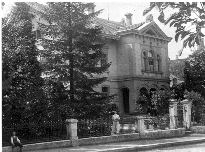
Nicht schutzwürdig: Villa Erica