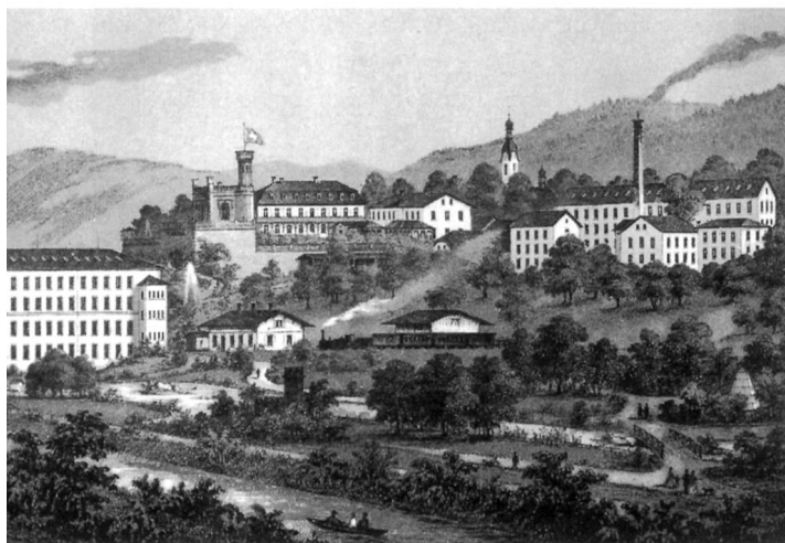
Schönenwerd um 1870. Links des Stiftskirchenturms der «Storchen» und die Villa Felsgarten mit dem «Schlössli»

In Schönenwerd hingegen ging die Verlagsindustrie bruchlos in die moderne Fabrikindustrie über. Das Bandunternehmen