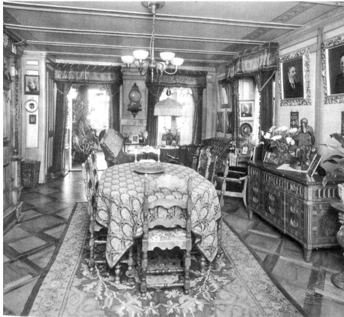
Interieur Villa Felsgarten, vor 1942

Dies drückt sich auch in der Bautätigkeit der Bally-Herren aus. Der Industriepionier umgab die vom Vater ererbte Villa Felsgarten mit einem luxuriösen Park und liess darin einen neogotischen, schlossartigen Gartenpavillon errichten. 6 Dem Ende der 60er-Jahre errichteten Industriekanal im Schachen liess er einen Entenweiher angliedern, der später zum berühmten Bally-Park ausgebaut wurde.