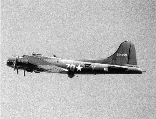
B-17G «Fliegende Festung»: gut erkennbar sind die MG-Stände an Bug, Heck, Rumpfober- und -unterseite.

neten, robusten und gegen Flakbeschuss unglaublich resistenten «Fliegenden Festungen» bildeten das Rückgrat der strategischen US-Luftflotten in Europa. Eine untergeordnete Rolle bei der kombinierten Bomberoffensive spielte die 1939 in Auftrag gegebene und in nur zwei Jahren zur Fronttauglichkeit entwickelte Be-24 «Liberator». Dank ihrer enormen Reichweite und ihrer Vielseitigkeit – verwendbar als Bomber, U-Boot-Jäger, Fernaufklärer und Transporter – kam sie vor allem im Mittleren Osten und in den endlosen Weiten des Pazifiks zum Einsatz.