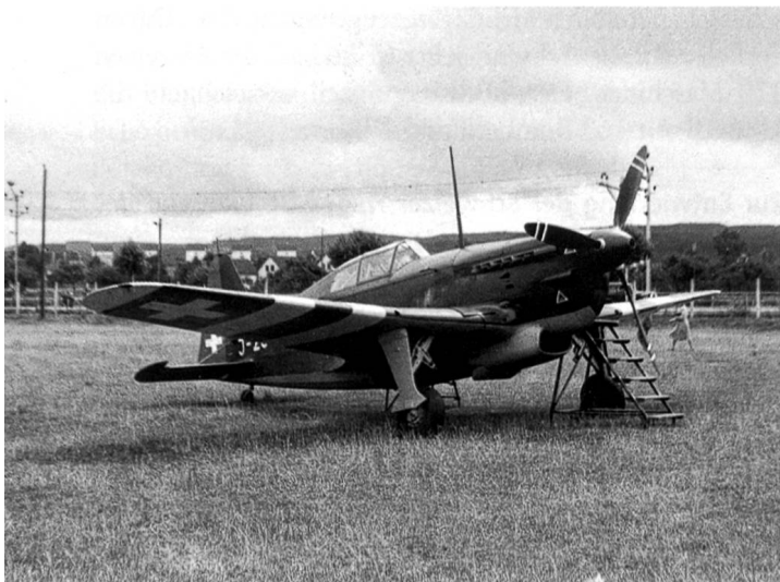
Morane-Jagdeinsitzer D-3801. Zur besseren Erkennung durch Freund und Feind erhielten Frontflugzeuge ab September 1944 Sondermarkierungen. Nach September 1945 wurden die Erkennungsstreifen am Rumpf und die weisse Bemalung der Motorverschalung entfernt. Dübendorf, 1947.

Am 28. April 1944 wurde in Dübendorf ein von Scheinwerfern geblendeter deutscher Nachtjäger vom Typ Messerschmitt Me-110 zur Landung gezwungen. An Bord befanden sich eine noch geheime Funkmessortungsanlage und die später als «schräge Musik» bekannt gewordenen, nach oben feuern 20-mm-Kanonen. Da eine Rückgabe aus Gründen der Neutralität nicht in Frage kam, wurde die Maschine im Beisein von deutschen Beobachtern gesprengt. Die als Gegenleistung zum Kauf angebotenen 12 Messerschmitt-Jäger der modernsten Version Me-109-G waren von so schlechter Qualität, dass sie nie voll einsatzbereit waren.