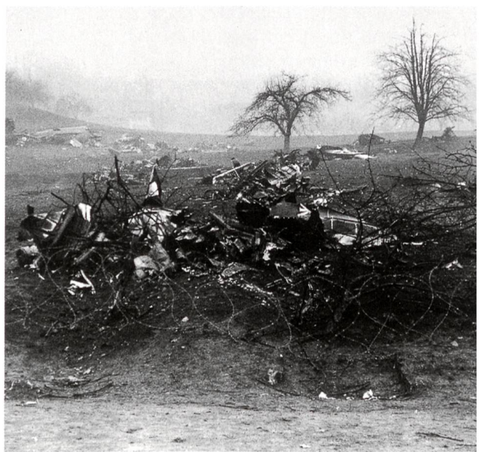
Die Absturzstelle: die weit zerstreuten Trümmerteile zeugen von der Wucht des Aufpralls.

Nach dem Absturz des amerikanischen Bombers im sogenannten Rintel ausserhalb Trimbach ist die Hilfe des Oltner Pikettes angefordert worden, um das in Brand geschossene Flugzeug zu löschen. Die nach 15.30 Uhr alarmierte Pikettgruppe traf innert wenigen Minuten auf der Absturzstelle ein. Der für die Löschaktion eingesetzte Luftschaumwagen hat sich wieder vortrefflich bewährt, so dass die Mannschaft nach kurzer Zeit wieder zurückgezogen werden konnte.