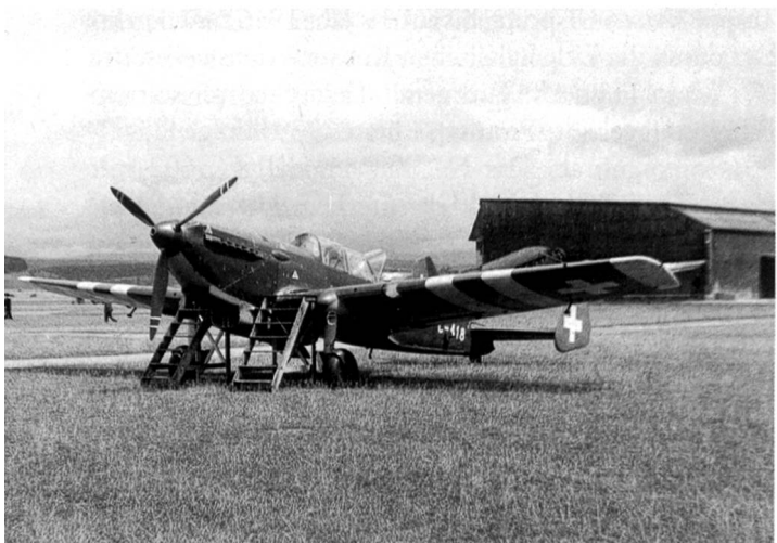
Mehrzweckflugzeug C-3603 mit weissen Erkennungsstreifen an den Flügeln. Morane und C-3603-Maschinen waren bei Landeinweisungen im Einsatz. Dübendorf 1947.

Das Ereignis wirft ein Schlaglicht auf den Kern des Problems: Eigenentwicklungen von Jägern liessen sich kurzfristig nicht realisieren; diese wären bei Erscheinen ohnehin technisch überholt gewesen. Alle Hoffnungen auf Erwerb ausländischer Typen oder Baulizenzen hatten sich zerschlagen.