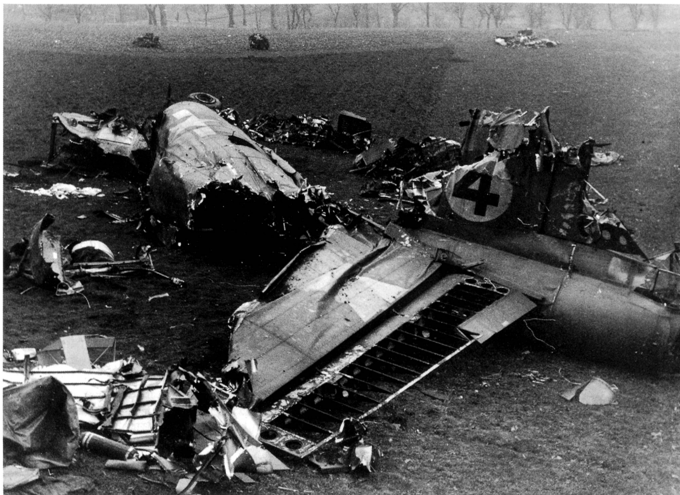
Hinterteil des Rumpfs und das Heck: gerade noch erkennbar der MG-Stand im Heck.