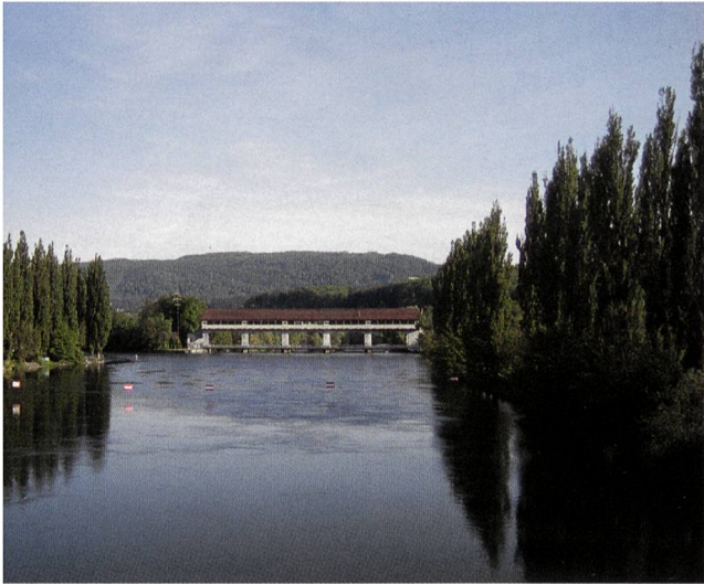
Das Stauwehr befindet sich vollständig auf Winznauer Boden.

Die Bootsstrecke endet am rechten Aareufer auf der Höhe der Aarburger Chlos. Wie in einem Abenteuerfilm dann die nächste Viertelstunde: Via Cheminéeabdeckung über einen Zaun auf das Bahntrasse, über die Geleise und eine halbsprecherische, dornenbewehrte Steilwand hoch. Nach kurzer Suche finden wir am Waldrand den zumindest allen ehemaligen Sälischulhaus-Kindern bestens bekannten Grenzstein mit dem Solothurner Wappen auf Oltner und dem Berner Wappen auf Aarburger Seite. Auf der Bergkrete steigen wir Richtung Sälischlössli höher und höher, bis die Grenze bei der zweiten Feuerstelle scharf nach links abbiegt und wir plötzlich Starrkirch-Wil, auf dessen Gemeindegebiet auch das «Oltner» Sälischlössli liegt, zu unserer Rechten wissen. Unsere Route verläuft auf der Höhenkurve dem Berg entlang ostwärts, durch eine Lothar-gepflügte Waldschneise zur Sälischlössli-Fahrstrasse und schliesslich hinunter in das Mühletäli. Mit der nötigen Rücksicht auf das gedeihende Saatgut folgen wir der Stadtgrenze querfeldein bis zur Gartenwirtschaft des «Wilerhofs» – neben dem Kantonsspital, dem Aareblick und der Gärtnerei Hagmann an der Aarauerstrasse übrigens eines von vier Gebäuden in Olten, die zu einem Teil auf dem Boden einer Nachbargemeinde liegen.