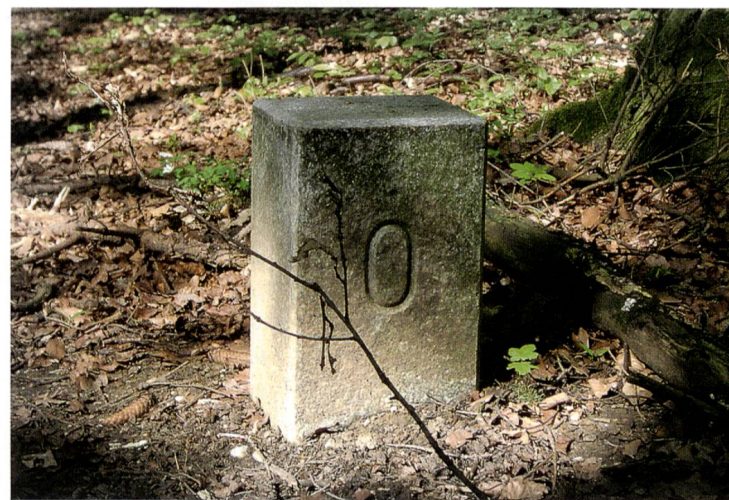
Ein markanter Grenzstein zwischen Olten und Wangen im Grubacher

Wir gehen der Sudseite der ehemaligen Druckerei Rentsch, welche heute das Bildungszentrum fur Gesundheitsberufe beherbergt, entlang und stossen schon bald auf die Baslerstrasse. Wahrend die Grenzlinie dort das Restaurant Kastaniengarten Trimbacher und die beiden auch zu dieser Tageszeit mit rot beleuchteten Fenstern auffallenden Zweifamilienhauser Oltner Boden zuweist, sehen wir