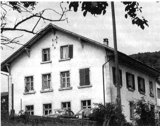
Das alte Schulhaus in Wisen

Ein bisschen Herzklopfen hatte ich schon, als ich zum ersten Mal das Klassenzimmer betrat und 20 Augenpaare mich erwartungsfroh musterten. Die Kinder gefielen mir auf Anhieb: Klare, offene Gesichter mit wachem Ausdruck, alle sauber gewaschen, die glänzenden Haare in Zöpfe geflochten oder mit einem «Taffetlätsch» verziert, waren mit zugewandt. Die Mädchen trugen ausnahmslos eine klein gemusterte Schürze, die Knaben handgestrickte Pullis und kurze Hosen. Nur die zwei Achtklässler sassen in Hemd und langen Hosen, wie junge Männer, mir gegenüber. Ich selbst hatte mich auch hübsch gemacht: Zum