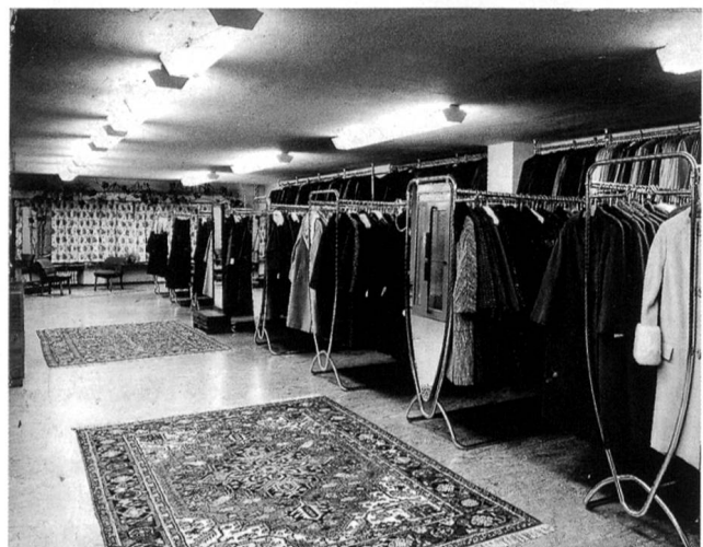
Damals: Grosszügige Innenräume –

1970 kauft die Firma Bernheim zur erneuten Vergrösserung des Geschäftshauses in Olten die Liegenschaft «Michel» (Hauptgasse 23). Gleichzeitig führt sie in ihren Geschäften den ganzjährigen Abendverkauf ein. In dieser Zeit halten die Warenhäuser in Olten Einzug. Innert weniger Jahre eröffnen EPA, Jelmoli, Migros, ABM, Coop und Nordmann ihre Geschäfte im Zentrum von Olten. Diese Veränderung im Detailhandel, die gleichzeitig einsetzende