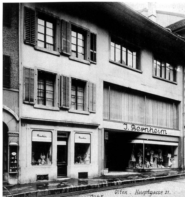
15 Jahre später: Modegeschäft J. Bernheim

Nach dem Krieg bricht die Zeit des «Wirtschaftswunders» an. Von diesem Aufschwung kann auch Bernheim profitieren und kräftig wachsen. Das Unternehmen bleibt dabei seinem fortschrittlichen Weg treu und setzt weiterhin Trends im regionalen Modegeschäft: Im Jahr 1949 organisiert Bernheim im damaligen Oltner Hotel Schweizerhof erstmals eine faszinierende Modeschau. Später wird diese ins Stadttheater und in den Konzertsaal verlegt, wo sie nach ein paar Jahren Unterbruch seit neustem wieder stattfindet. Beim 20-Jahr-Jubiläum im Jahre 1951 beschäftigt Bernheim rund 90 Personen und ist damit das führende Modegeschäft in der Region Olten. Das Geschäft läuft nun so gut, dass am 8. September 1956 in Aarau ein weiterer Laden eröffnet werden kann. Heute ist die Filiale in Aarau das umsatzstärkste der insgesamt vier Bernheim-Geschäfte und sie kann demnächst das 50-Jahr-Jubiläum feiern. Doch auch an der Hauptgasse in Olten wird Mitte der 50er-Jahre der Platz eng. Deshalb erwirbt Bernheim die Liegenschaft Tuch-Flury an der Kirchgasse und richtet hier das Geschäft für Herrenmode, einen Stoffladen, das Schneiderei-Atelier und die Administration ein. In-