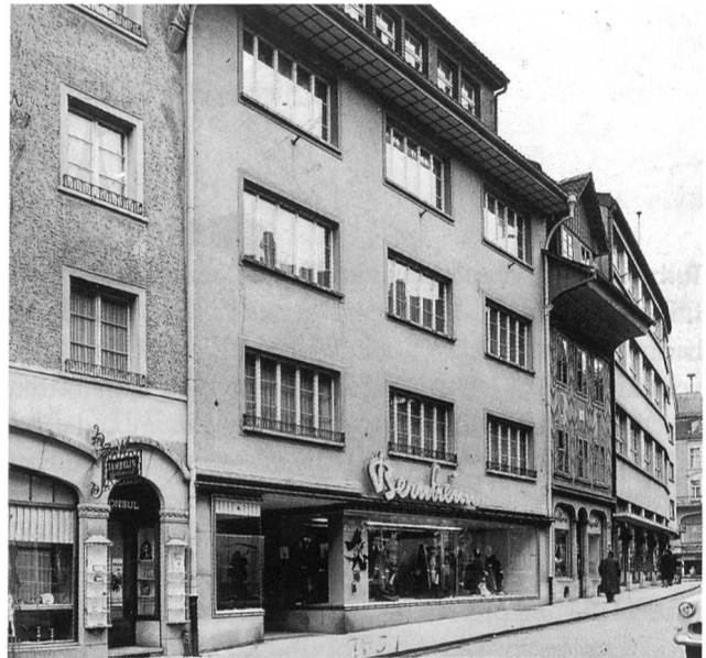
Das Geschäft an der Hauptgasse nach dem Umbau 1951