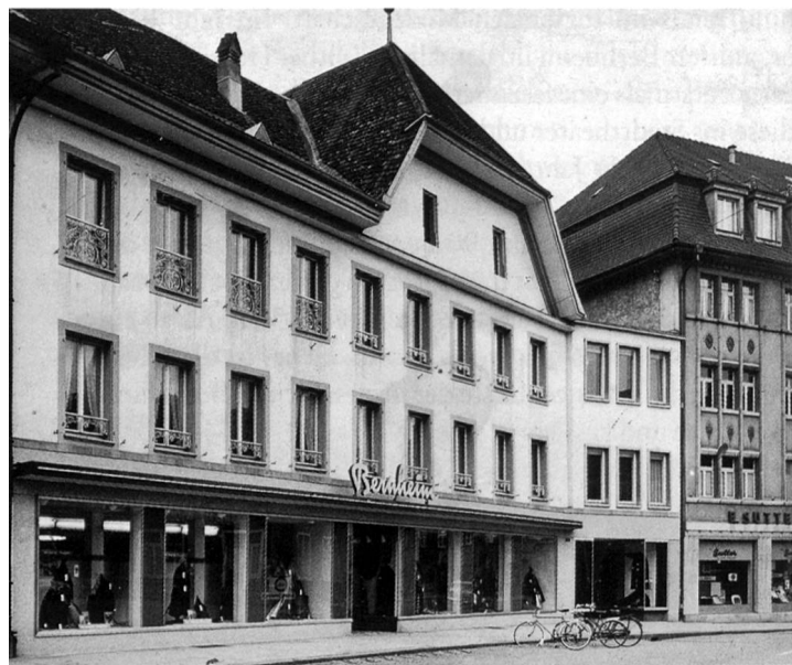
Herrenmode Bernheim an der Kirchgasse