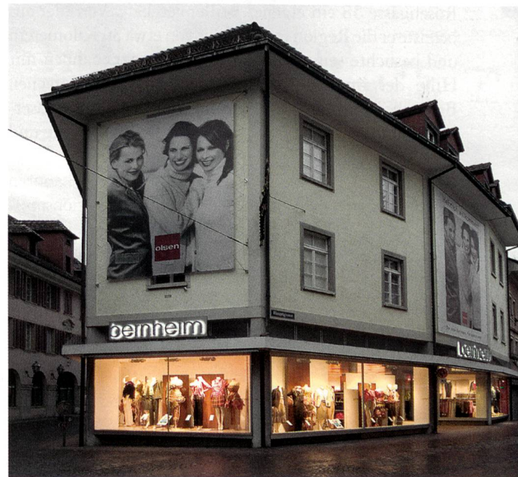
Bernheim, Hauptgasse 30

Bernheim ist heute nach wie vor ein Familienunternehmen, das sich sowohl der eigenen Tradition als auch dem steten Fortschritt verpflichtet fühlt. Die spürbare Leidenschaft für Mode der Besitzerfamilie und aller Mitarbeitenden war während der letzten 75 Jahre ein wesentlicher Erfolgsfaktor und sie dürfte dies auch in Zukunft sein. Heute beschäftigt das Unternehmen in Olten 57 und in Aarau 34 Mitarbeiterinnen und Mitarbeiter. Das Team von «Mode Bernheim» kennt den regionalen Bekleidungsmarkt bestens. Es ist die Ambition des Modehauses Bernheim den Menschen in Olten und Aarau einen individuellen und persönlichen Zugang zu den neusten Modetrends zu bieten – in der Vergangenheit, der Gegenwart und in der Zukunft.