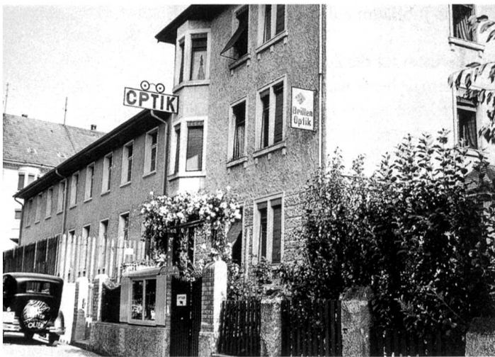
Das erste Trotter-Geschäftshaus an der Rosengasse, um 1930