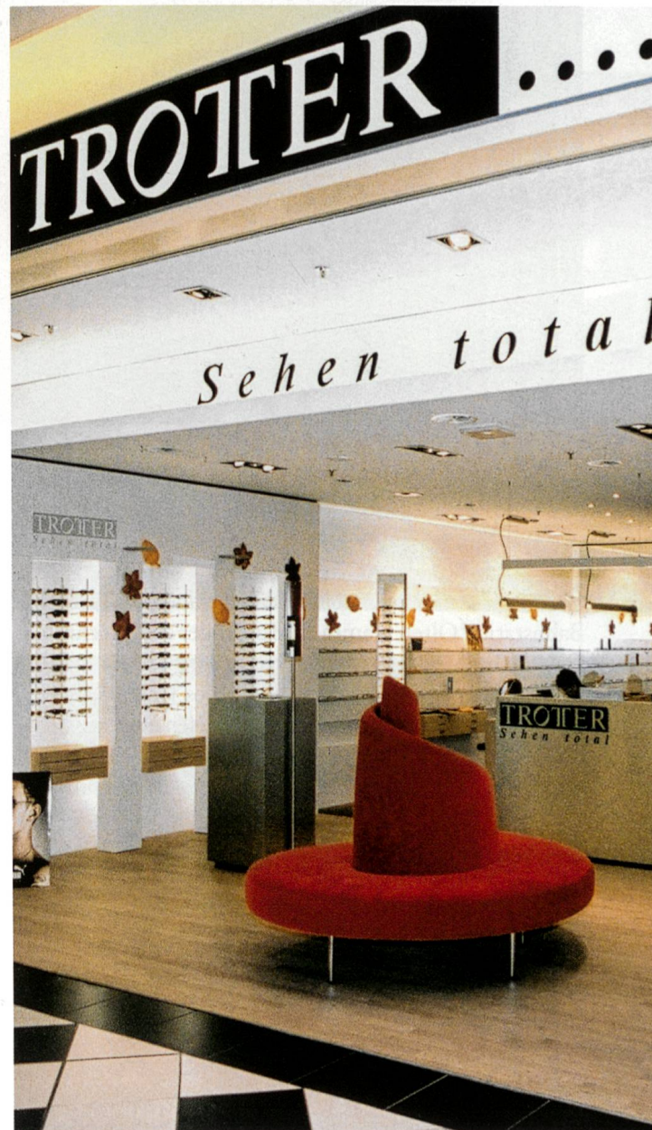
Das neue Trotter-Brillengeschäft im Sälipark