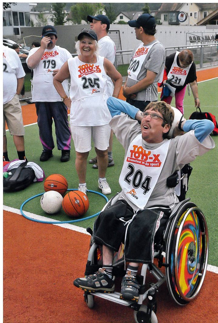
Pro-Cap Sporttage 2008 in Olten

Der Schweizerische Eisenbahner-Sportverband führte im April die nationale Meisterschaft im Volleyball durch, an der sich das Team aus Olten bereits zum sechsten Mal den Meistertitel sichern konnte.