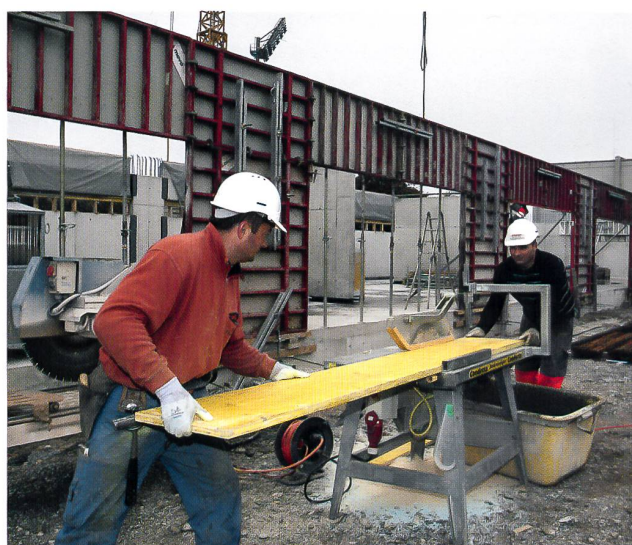
Das Garderobengebäude beim Stadion Kleinholz ist in Bau

Die Sportstättenplanung im Kleinholz wird trotz nicht verstummender Kritik am Standort konsequent weiter vorangetrieben. Im August 2008 wurde der Spatenstich für das neue Garderobengebäude vollzogen, und dieser neue Trakt kann im Jahre 2009 den Sportlerinnen und