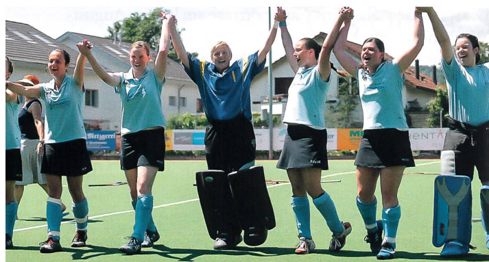
HC Olten, Cupsieger 2008 im Landhockey