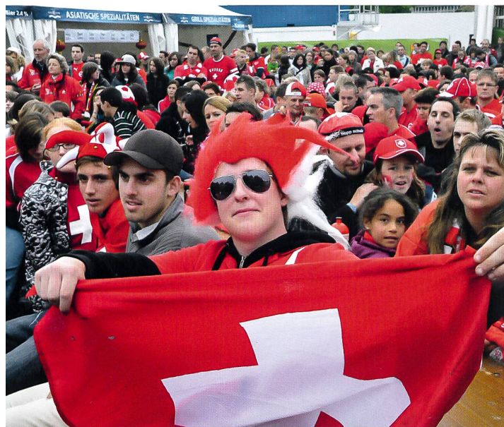
Public-viewing auf der Schützenmatte anlässlich der Euro 08

2008 war mit der Fussball-Europameisterschaft in der Schweiz und in Österreich im Juni und den Olympischen Spielen in Peking im August ein ganz besonderes Sportjahr. Diese beiden Grossanlässe prägten das Sportgeschehen über weite Strecken und waren in allen Medien vorrangig. So wurden all die anderen wertvollen Breitensportanlässe eher stiefmütterlich beachtet. Organisatoren von nationalen und auch regionalen und kantonalen Anlässen hatten grösste Mühe, Sponsoren zu finden. Ohne dieses finanzielle Engagement lassen sich heute kaum mehr Meisterschaften oder Breitensportanlässe durchführen. Es sei deshalb allen Organisationen gedankt, die immer wieder Sportanlässe unterstützen und damit einen wertvollen Beitrag an die Volksgesundheit leisten.