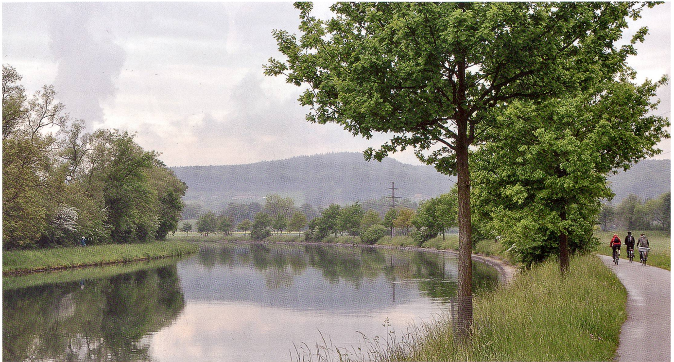
Idylle am Aarekanal im Niederamt

Mit einer gemeinsamen Velotour von Zofingen nach Aarau eröffneten im September rund 25 Behördenmitglieder den neugeschaffenen AareLandWeg. Er verbindet über eine Strecke von rund 30 Kilometern im wahrsten Sinne des Wortes erfahrbar die drei Städte Aarau, Olten und Zofingen. Der auch zu Fuss zu geniessende AareLandWeg ist ein Projekt, welches im Rahmen der Zusammenarbeit der drei Städte und Regionen Aarau, Olten und Zofingen sowie der Kantone Aargau und Solothurn entstanden ist. Entlang der Route werden Informationen zu Sehenswürdigkeiten und Besonderheiten vermittelt.