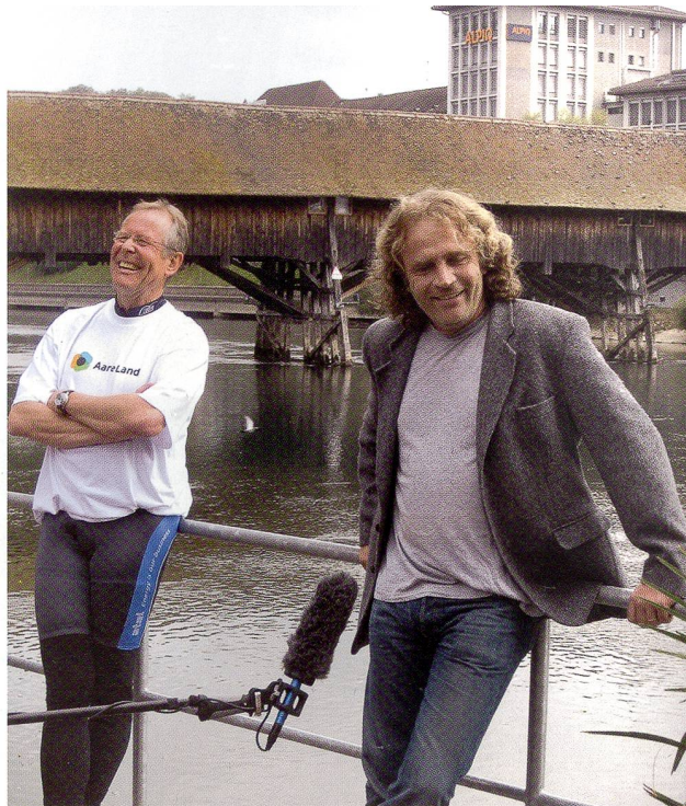
Stadtpräsident Ernst Zingg und Schriftsteller Alex Capus begrüßen den Tross bei der Eröffnungsfahrt sichtlich gut gelaunt vor der Oltner Holzbrücke im Hintergrund.

Der AareLandWeg zeigt auch ein Stück Industriegeschichte auf. Besonders eindrücklich lässt sich dies bei Schönenwerd im Bally-Areal erleben. Zu Zeiten der Bally-Dynastie war Schönenwerd eines der blühendsten Industriedörfer der Schweiz. Fabrikbauten, Arbeitersiedlungen, Fabrikantenvillen, stattliche Schulhäuser und der romantische Bally-Park zeugen davon. Während der Blütezeit der Schuhfabriken von der Mitte des 19. bis zur Mitte des 20. Jahrhunderts verzehnfachte sich die Einwohnerzahl der Gemeinde. Die Industrialisierung veränderte das