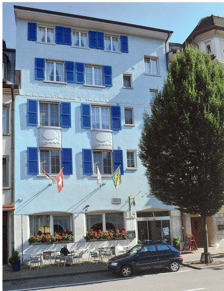
Das zweite Kolpinghaus an der Ringstrasse 27, heute das Restaurant «Kolpinghaus»

1968 teilte die Kirchgemeinde dem Gesellenverein mit, dass sie das alte Pfarrhaus in ein Pfarreijugendzentrum umbauen wolle, und der Gesellenverein mit der Kündi-