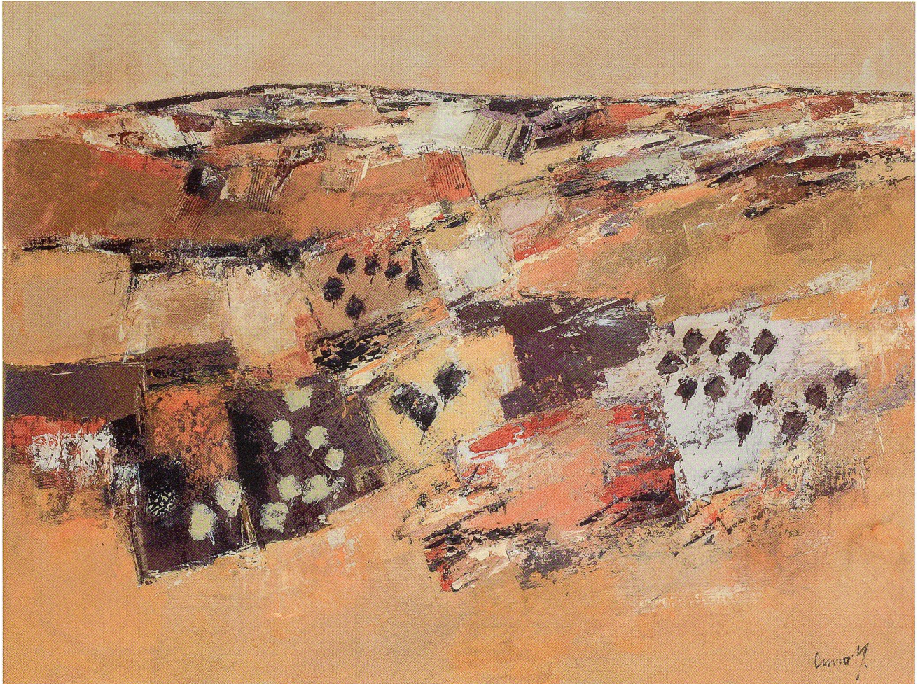
Südlicht, Acryl auf Leinwand, 2010, 93 x 119 cm