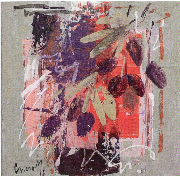
Südliche Fragmente, Acryl auf Leinwand, 2008, 22 x 22 cm