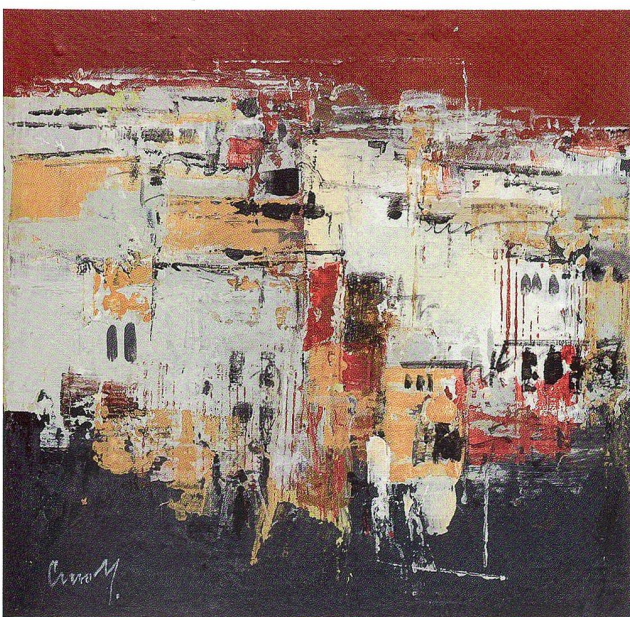
Erinnerungen V, Acryl auf Leinwand, 2010, 30 x 30 cm

steinigen Weg geht. In den letzten Jahren sind neben den Landschaften und Stilleben die Figurenbilder immer wichtiger geworden. Formal beginnt er deutlich zu abstrahieren, reduziert figurative Betonungen, arbeitet mit Farben, mit Strukturen und Kontrasten. In seinen neuen Figurenbildern erkennt man nur mehr Fragmente, lang gezogene Markierungen menschlicher Körper, gruppenweise oder als einzelne Figur im Raum stationiert. Die Farben wirken in sich verhalten, gespielt wird mit Hell- und Dunkelbetonungen. So erlebt man ein ständiges Auf und Ab in der Bewegung, in der Veränderung des Lichtes und der Position, und doch spürt man bis in jede Faser hinein die menschliche Präsenz seiner Figuren. Oft glaubt man, die Figuren kämen auf einen zu, oder dann stehen sie in abwartender Haltung im Raum, als möchten sie den Betrachter auf etwas aufmerksam machen. Interessant sind die ungewöhnlichen Bildformate, die der Künstler wählt. Bald ein in die Breite gezogenes Band oder dann ein schmales, hochgezogenes Format, so dass zusätzlich Spannung entsteht, die fesselt und neugierig macht.