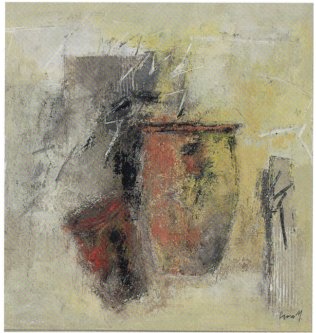
Gesehen – geblieben!, Acryl auf Leinwand, 2007, 88 x 88 cm

Erklärung, man darf sie nach Lust aufleben lassen, mit ihnen spielen und variieren, und immer wieder entsteht etwas Neues, das beflügelt. Fesselnd sind seine neuen grosszügigen abstrakten Bildräume in differenzierten, lebhaften Farbkombinationen, die den Betrachter auf Antrieb begeistern. Durch die schwungvolle Pinselführung erkennt man ein Farbenspiel, das emotional bewegt und auch Rätsel aufgibt. Blaue Bildräume, durchzogen von Grau und milchigem Weiss, strahlen träumerische Ruhe aus. Sandtöne, aufgehellert von farbigen Schimmern, erzählen von der Heiterkeit südlichen Lebens und auch das Dunkle und Verhangene einer Graukomposition ist voller liebenswerter Melancholie. Manchmal wünschte er sich, dass er dynamischer, spontaner an seine Arbeit gehen könnte und nicht so kritisch sich selbst gegenüber stünde. Seine unruhige Suche nach Neuem ist unendlich; er weiss, dass nichts in sich abgeschlossen ist, dass man immer unterwegs ist und die Suche nach der gültigen Ausdrucksform unendlich bleibt. Das Malen ist ein Vorgang, der sich in sich selbstständig verändert, und dessen ist sich Cuno Müller in fast schmerzlicher Erkenntnis bewusst.