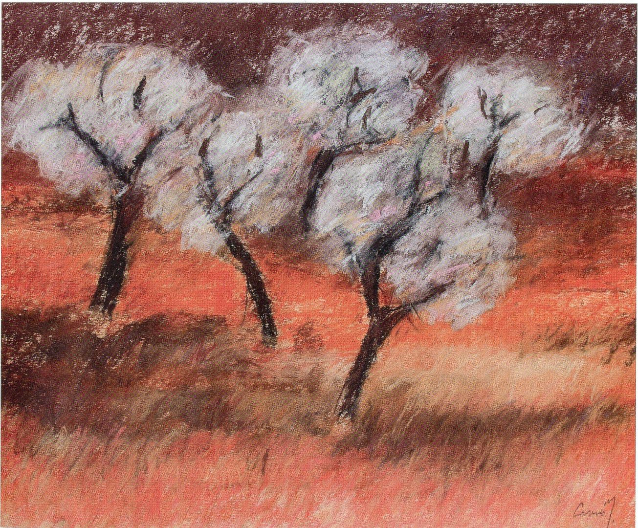
Blühende Mandelbäume, Pastellkreide, 2010, 69 x 80 cm