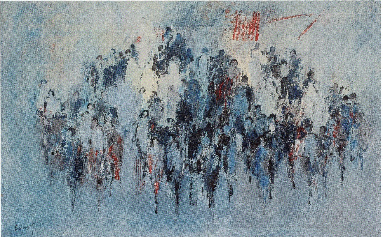
Es war Zeit zum Flanieren, Acryl auf Leinwand, 2007, 76 x 119 cm

Landschaft bestimmen. Auch in seinen Figurenbildern entdeckt man bewusst gewählte Farbkombinationen: Braun und Sand mit Schwarz, oder alle Figuren in Blau eingefangen, mit viel Weiss aufgehellt und mit Schwarz markiert. Auch andere Farbkombinationen sind möglich, und jedes Mal erlebt der Betrachter eine völlig neue Situation. Stille, besinnliche Momente werden zu explosiven, dynamischen oder man verliert sich in sanfte schwarz-weiss Kontraste, erlebt differenziertes Grau, der Möglichkeiten sind viele. Cuno Müller bevorzugt unterschiedliche Motive: Gartenstühle in einer Laube oder in der Wiese, Häusergruppen in der hügeligen Landschaft, dichte Menschengruppen, die sich manchmal fast bedrängen, flatternde Tauben oder Hühner, leuchtende Blumen und auch Bilder von der Fasnachtszeit mit närrischen Figuren, die den Fasnächtler verraten. Cuno Müller ist mit der Oltner Fasnacht sehr verbunden, arbeitete auch in Cliquen mit, schuf Laternen und Plakate, liebt die Farbigkeit der Kostüme und Masken.