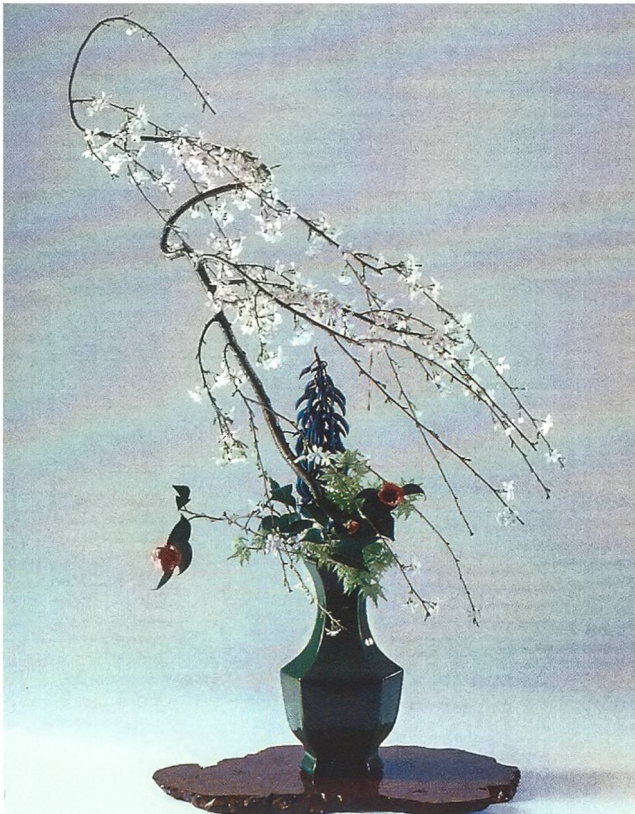
Frühlingsarrangement mit blühenden Kirschzweigen, roten Kamelien und einem Blätterzweig in einer chinesischen Vase mit aufpoliertem Holzuntersatz

MIT GOLD- UND SILBERSTRAHLEN» im Namen des Japanischen Kaisers und des Regierungschefs in Empfang nehmen. Dies als Anerkennung für meinen grossen Einsatz zur Bekanntmachung der japanischen Kultur in der Schweiz.