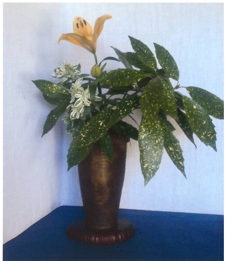
Arrangement mit einem Aucubazweig, einer lachsfarbenen Lilie und drei Wolfsmilchstengeln