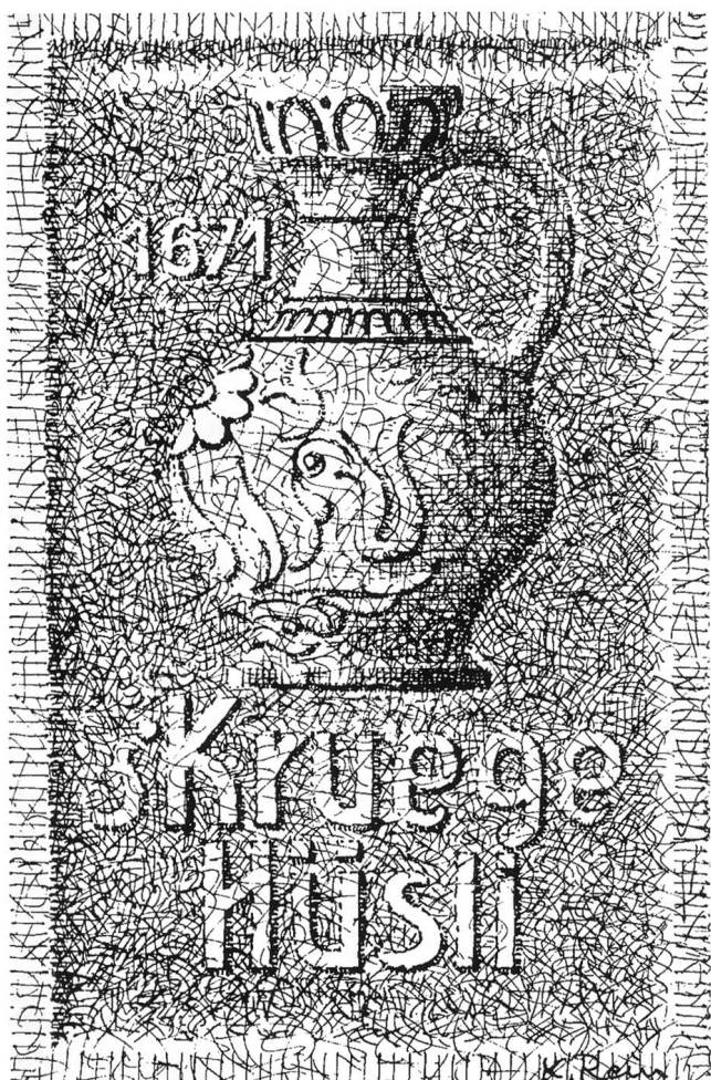
Karl Rein, Entwurf für das Hauszeichen am Haus Zielempgasse 6 25

In das Kapitel «halbe Wahrheiten» gehören auch Evidenzschlüsse, d. h. Schlüsse, die aus zwei quellenmässig belegbaren, zeitlich aber weit auseinanderliegenden Fakten gezogen werden. Von einem solchen Evidenzschluss zeugt zum Beispiel die Bildtafel an dem kleinen Häuschen unterhalb der Jugendbibliothek oder des früheren Gefängnisses an der Zielempgasse in Olten. Sie zeigt einen wahren Krug und die Jahrzahl 1671 20 , darunter die Inschrift «s Kruege Hüsl». Die Tafel, ein Entwurf des ehemaligen städtischen Hochbautechnikers Karl Rein, wurde seinerzeit in der Kunststeinfabrik Adolf Schenker ausgeführt, wie ein Artikel im Oltner Tagblatt zu berichten weiss. 21 Sie nimmt Bezug darauf, dass im 17. Jahrhundert (anno 1664) ein Heinrich Krug in der Fröschenweid ein Haus erworben hat, 22 und darauf, dass sich offenbar dieses Häuschen gegen Ende des 19. Jahrhunderts «noch immer» im Besitz der Familie Krug befand. Bloss, und das hat Dr. Hugo Dietschi, den dieser Umstand zu seinem Zeitungsartikel veranlasste, übersehen, heisst es im Grundbuch von 1825, der damalige Besitzer, Josef Krug, der Sohn des Schneidermeister Conrad Krug, habe die Liegenschaft am 1. Oktober 1803 leibgedingsweise ohne Preis von Josef Bürgi erkaufte. 23 Ein Blick in das Grundbuch von 1825 hätte also den Schreiber davor bewahren können, Anlass zu geben zur Anbringung einer Tafel, die eigentlich jeder Grundlage entbehrt. 24