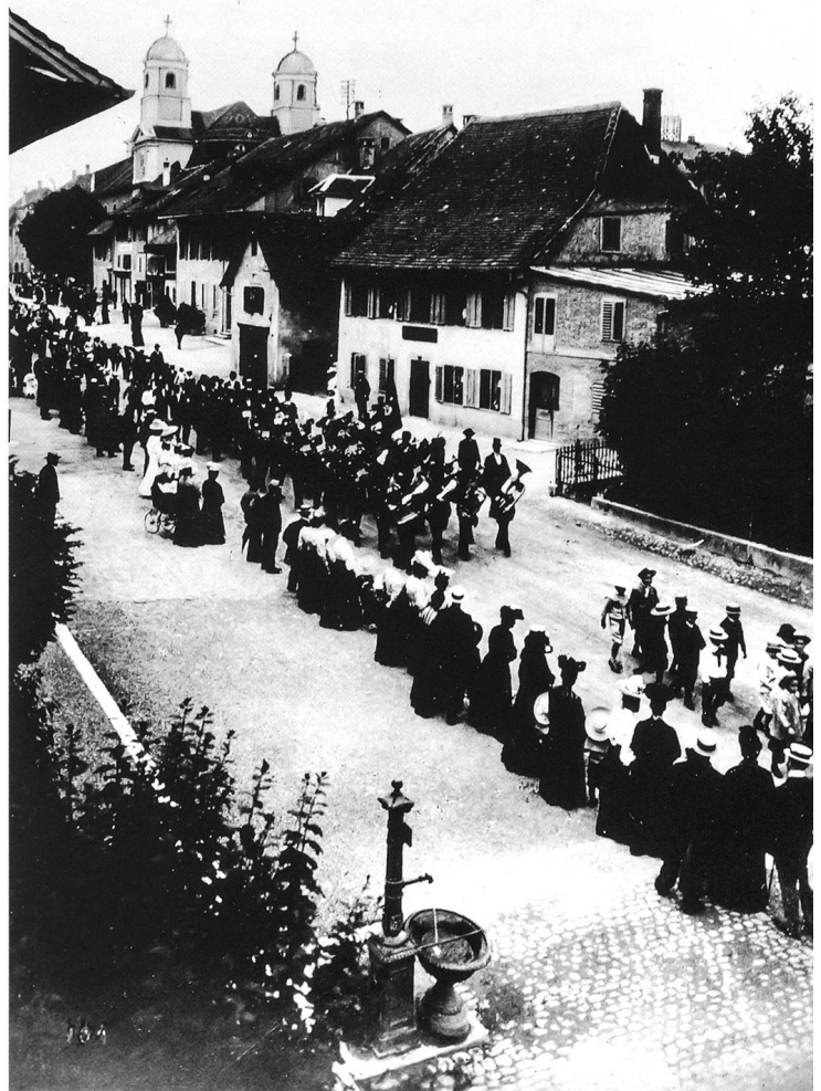
Gusseisener Brunnen an der Baslerstrasse, Schulfest 1906