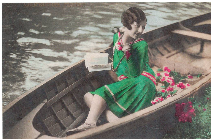
«Glückliches Hoffen», undatierte Postkarte, Amag 64015/5, ca. 1920

Kirchgasse, um selbstgefertigte Gegenstände, besonders Kleider, zusammenzutragen und aus dem Erlös dieser Freiwilligenarbeit Notleidenden zu helfen. «Es ist mit dem Charakter des Weibes,» so war im «Oltner Wochenblatt» zu lesen, «von der Mutter Natur ein Zug verwoben, dem Mitmenschen Liebes und Gutes zu erweisen. Die Gefühle des Weibes sind, wenn sie nicht durch Unarten - Putzsucht, Modenschwindel, hohles Phrasengeklimper u. dgl. mehr - verkümmert sind, weit empfänglicher für die Sorgen und Leiden der Mitmenschen.» 5 Im Jahre 1879 fusionierten die beiden Frauenvereine und schlossen sich 1891 mit dem von Männern getragenen «Verein gegen den Hausbettel» zur «Freiwilligen Armenpflege Olten» zusammen. Sechs Jahre später erfolgte die Umbenennung zum «Hilfsverein Olten», der bis zum Jahre 2005 bestand. 6