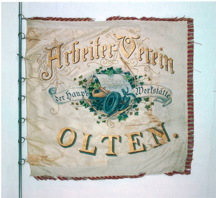
Seidenfahne «Arbeiterverein Hauptwerkstätte Olten» vor der Konservierung