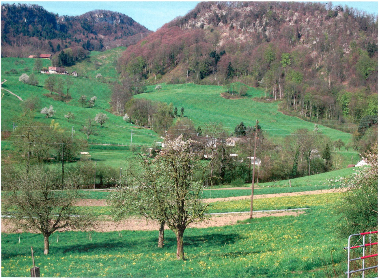
Das Gebiet Miesern in Trimbach (SO). Etwas links der Bildmitte, am Rand des Bachgehölzes, liegt der Fundort von Vanhornia leileri .

Die dreibändige Reihe «Exkursionsfauna von Deutschland» von E. Stresemann und Mitarbeitern behandelt die Fauna der ehemaligen DDR und BRD. Im allgemeinen lassen sich damit aber auch die meisten Tiere aus der Schweiz, zumindest nördlich des Alpenkammes, einer Art, Gattung oder zumindest einer Familie zuordnen. Im Falle der kleinen schwarzen Wespe ge-