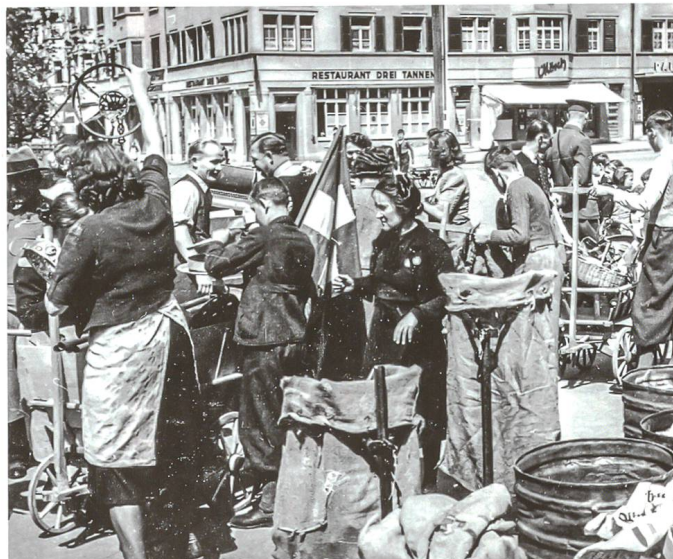
«Ghüderdienst» während des Zweiten Weltkriegs