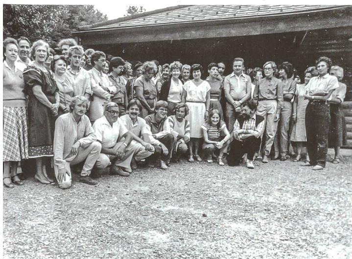
Ferienpass-Abschlussfest 1983 in der Gretzenbacher Waldhütte

Auch am Gemeinnützigen Frauenverein Olten ist der Wandel der Zeit nicht spurlos vorbeigegangen. Waren nach dem Zweiten Weltkrieg noch fast alle Frauen «nur» Hausfrauen, sind heute fast alle Frauen mindestens in einem Teilpensum in der Arbeitswelt tätig. Diese Entwicklung zeigt sich auch bei den Mitgliedern des GFVO. War es früher selbstverständlich, sich ehrenamtlich und gemeinnützig zu engagieren, ist die Gewinnung von neuen Frauen für den GFVO zunehmend schwierig. Selten will jemand einen Teil seiner Freizeit für gemeinnützige Arbeit «opfern». So sind es vor allem frisch pensionierte Frauen, welche wieder vermehrt tagsüber Zeit haben, um z. B. mit älteren Menschen Zeit zu verbringen und diesen ein paar angenehme und unterhaltsame Stunden zu beschern. So sind einige Angebote des GFVO wie beispielsweise das Kerzenziehen oder die Familien- und Betagtenhilfe einfach verschwunden oder wurden mit anderen Organisationen zusammengeführt. Andere Angebote wie zum Beispiel die Adventsfeier hal-