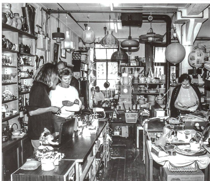
Mensa im Berufsbildungszentrum Olten (oben) und Brocki 1991