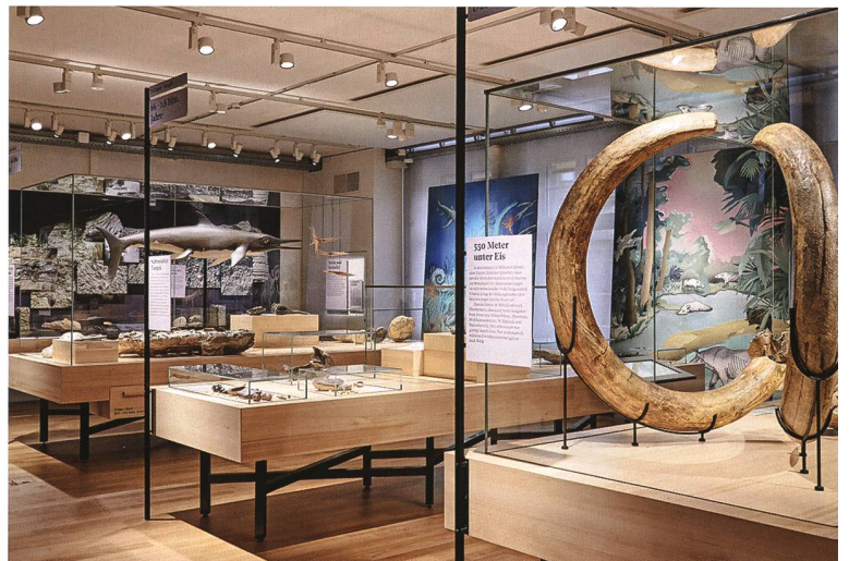
So viele faszinierende Geschichten in einem Raum