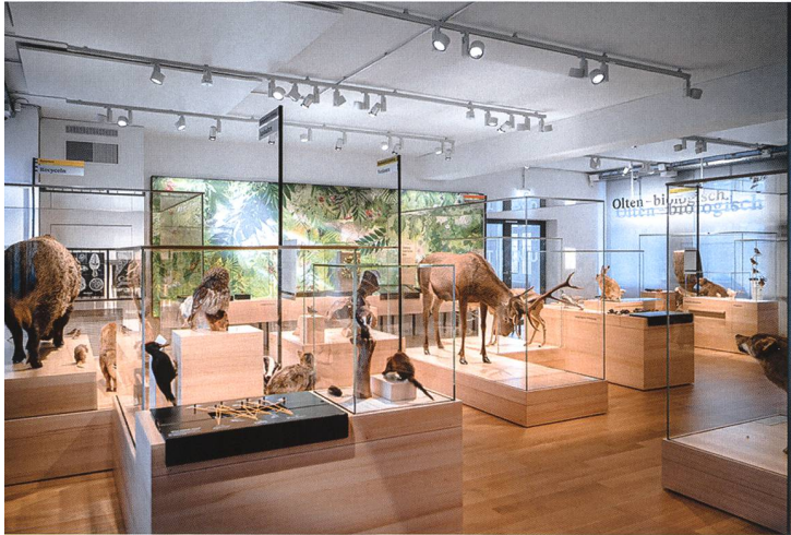
Viel Raum und viel Licht im neuen Naturmuseum