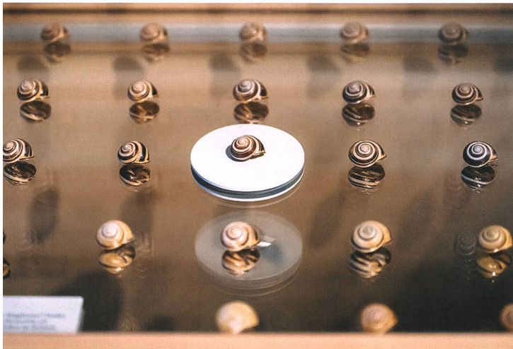
Gleich und doch verschieden am Beispiel der Hainschnirkelschnecke. Variabel sind Farben und Bänderung des Häuschens.

ckiger auf die Frage, was er aus dem alten Haus allenfalls vermisse. «Zwar war es ein anspruchsvoller und manchmal auch leidvoller Prozess. Die Essenz herauschälen, bis nur noch da war, worauf es wirklich ankommt, wenn es ums didaktische Darstellen der Biodiversität, der biologischen Vielfalt der Region geht, das war nicht einfach.» Dabei habe man sich von verschiedenen Kriterien leiten lassen. «Die ausgewählten Exponate sollen Identität stiften, Emotionen wecken und Geschichten erzählen.»