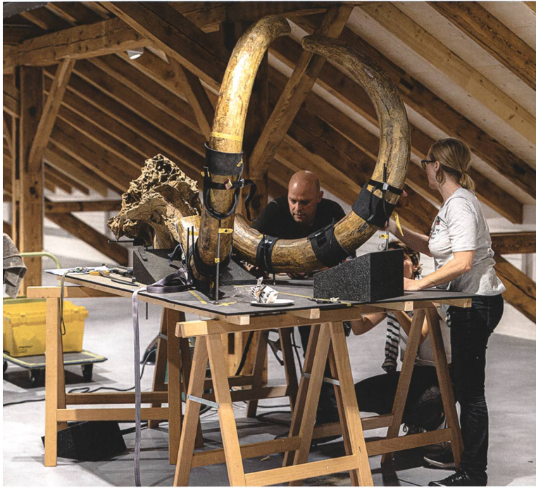
Auf dem Weg in die neue Ausstellung: Die Mammutstosszähne, vor über 100 Jahren in der Nähe des Bahnhofs gefunden, waren lange das Flaggschiff des Naturmuseums Olten.