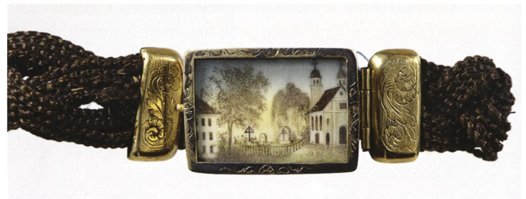
Detail eines Armbandes

Herstellungszentren der Haarflechterei waren einerseits Klöster, andererseits wurde diese Kunst auch in verschiedenen Gegenden Europas gepflegt. In Deutschland geschah dies vor allem in Sachsen. Skandinavien kennt ebenfalls eine lange Tradition der Bearbeitung dieses Materials. In Russland erfreuten sich offenbar die Haarmosaikarbeiten des Grigori Boruchow grosser Beliebtheit. Zu den bekannten Produktionszentren der Schweiz zählen nebst Appenzell verschiedene Regionen der Innerschweiz wie Unterwalden und Zug, aber auch Zürich gilt als wichtiger Herstellungsort. Im Kanton Aargau stellte die Strohindustrie Bordüren vorwiegend aus Schweifhaaren von Pferden her.