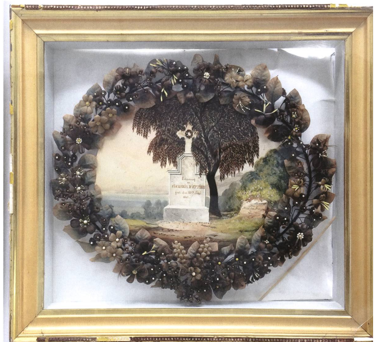
Kastenbild HMO.1021 mit unterschiedlichen Schäden

Bei der Produktion der Haararbeiten werden die Haare zunächst gut gewaschen und danach die benötigte Menge abgezählt. Bevor mit dem Flechten begonnen werden kann, müssen die einzelnen feinen Stränge auf einer speziellen Vorrichtung aufgespannt werden. Als Vorlage für die Herstellung der verschiedenen Haarflechtereien kommen, wie beim Klöppeln, sogenannte Briefe zum Einsatz, auf denen das Muster eingezeichnet ist. Die fertiggestellten Objekte müssen anschliessend eine halbe Stunde in Wasser gekocht, danach auf ein Papier gelegt und mit Wärme getrocknet werden. 4 Bei Trauerandenken wurden zusätzlich die Haare in bestimmte Formen geschnitten und mittels Pinzette auf den Untergrund des Bildes platziert und angeklebt.