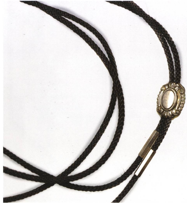
Detail einer Halskette. Das engmaschige Geflecht soll auf Appenzell als Produktionsort verweisen.