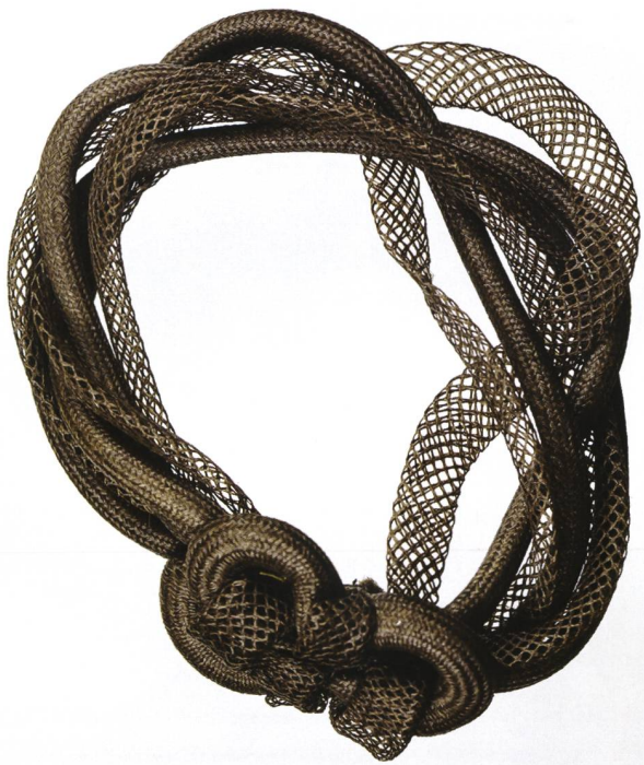
Verschiedene Flechttechniken an einem Haar- oder Armband

Die Produktion der Haararbeiten lässt sich im Wesentlichen auf das 19. und frühe 20. Jahrhundert eingrenzen. Die Anfänge der Haarflechterei gehen allerdings bis in die Mitte des 18. Jahrhunderts zurück. Es handelt sich nicht um ein spezifisches Oltner oder Solothurner Phänomen. Haararbeiten waren vor allem während des 19. Jahrhunderts weit verbreitet. Wie Rusch 2 in seinem Aufsatz erläutert, sind Haare ein kommerziell genutzter Teil des menschlichen Körpers. Sie dienen (und dienen) als Rohstoff in der Perückenmacherei, als Bestandteil technischer Geräte wie Haarhygrometer, aber ebenso für die Herstellung von Schmuck und Erinnerungstücken.