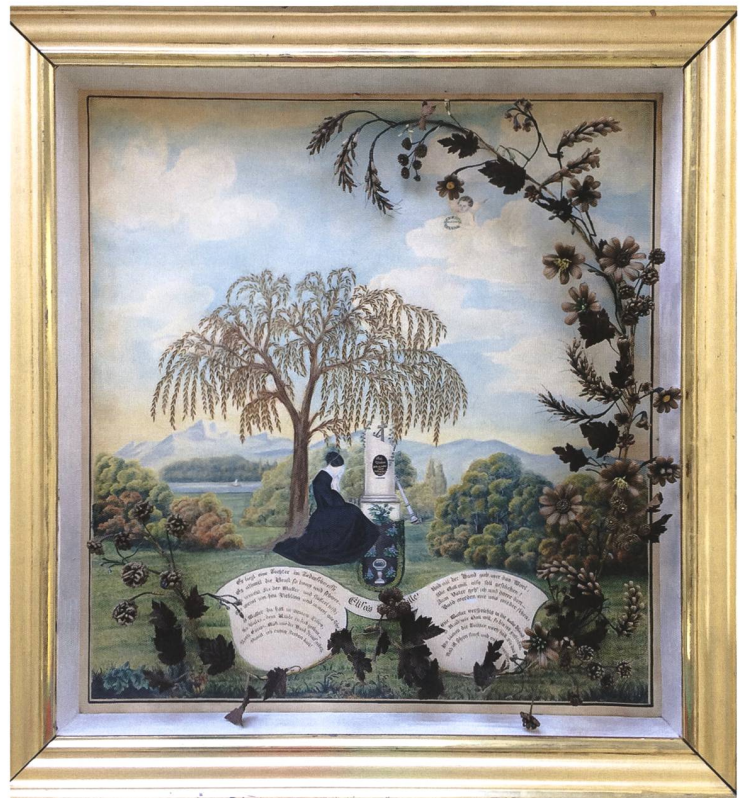
Verschiedene Techniken kamen bei Kastenbild HMO.1012 zur Anwendung.

Wiederkehrend ist bei den Haarbildern die Verwendung von Papier, Karton und Lochkarton mit Stickeren, filigranen Gestecken und Ranken aus Haaren sowie Glasperlen und Bändern. Andere Kompositionen, die dreidimensionale Ranken aufweisen, verfügen über eine beachtliche Bildtiefe. 6 Die mit einem Goldrahmen eingefassten Bilder sind imposant. Sie weisen nebst Blumenranken aus Haaren und Perlen in Aquarelltechniken aufgemalte Szenerien mit Landschaften, Grabstätten, den Namen der Toten sowie Abschiedsverse auf. 7