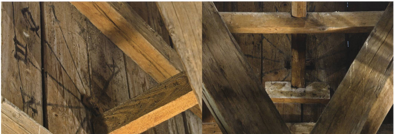
Die beiden auf den Bretterverschalungen der beiden Stadtkirchentürme aufgerissenen Zifferblätter, wie sie sich 2013 noch bei starker Beleuchtung präsentierten. Links Seite Baslerstrasse, rechts Seite Munzingerplatz. Auf den ins Zentrum der Zifferblätter führenden Balken fanden sich damals noch kleine stimmgabelförmige eiserne Führungen für das Übertragungsgestänge des Uhrwerks.

Nun gibt es von dieser Uhr an der Stadtkirche ja auch Bilder. Die ältesten von ihnen sind vom ersten Oltner Fotografen Emil Werner gemacht worden und finden sich in einem Leporello, das Emil Werner anno 1874 zum Kauf anbot. 2 Auf den beiden Bildern, deren eines vom Galgenhölzli [vom Frohheim] aus, das andere vom Hardkänzeli aus aufgenommen wurde, lassen sich allerdings nur die Zifferblätter an den beiden Türmen feststellen. Ob es sich bei diesen Uhren um solche mit Stunden- und Minutenzeiger oder um solche mit bloss einem einzigen Zeiger gehandelt hat, lässt sich wegen der grossen Entfernung, aus der die Aufnahmen ge-