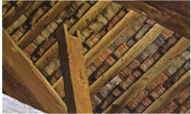
Detail eines Ständers der ehemaligen Übertragungsleitung auf dem Estrich der Stadtkirche

Auch wie ehemals die Übertragung der Drehbewegung vom Uhrwerk auf die beiden Zifferblätter an den Türmen erfolgt war, liess sich 2013 noch klar dokumentieren. Davon zeugten an den Bindern angebrachte hölzerne Träger mit u-förmigen Ausschnitten. Sogar die von der Front bis an das Tretrad über den Bindern verlegten Bretter liessen sich als Service-Steg für den Uhrenaufzieher erklären, der die Uhren ja nicht nur aufzuziehen, sondern auch regelmässig zu schmieren und zu richten hatte. Meinen Versuch, auf diesen Steg hinauf zu steigen, gab ich damals auf, weil schon der erste Seigel der bloss angelegten Leiter unter meinem Gewicht durchbrach.