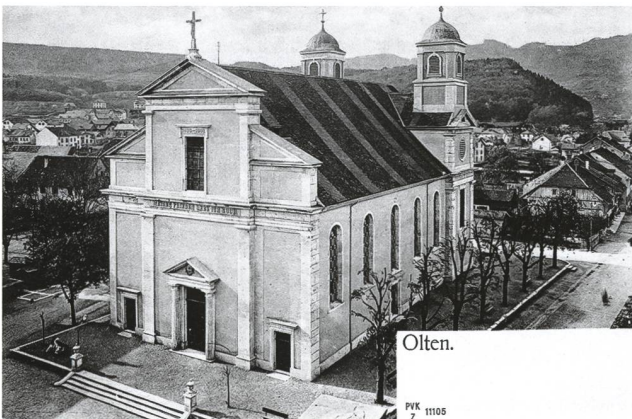
Die Stadtkirche um 1898 und nach der Renovation von 1901

novation von 1901 entfernt worden ist: Weil sie, schwerfällig und fast 300 Jahre alt, wie sie offenbar war, regelmäßig geschmiert werden musste, verschmutzte die dem Gestänge entlang laufende Schmiere in nicht unbeträchtlichem Masse die Giebelfront unterhalb des Zifferblattes, sodass man sich 1901 entschloss, das alte Uhrwerk ausser Betrieb zu setzen und die Zifferblätter an Front und Türmen wieder zu entfernen.