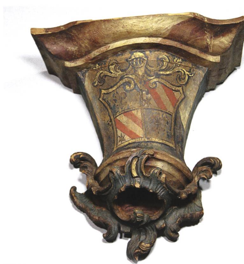
Die barocke Uhrenkonsole aus dem Klosterestrich