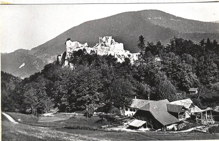
Alt Bedburg - Holderbank (So)

Stammitz des Grafen Bedburg um's Jahr 1100 P. Hess